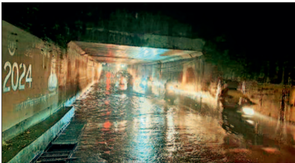
दिवनसिटी में झमाझम बारिश से चंद्रा-मौर्या अंडरब्रिज पर पानी भर गया।

दिवनसिटी में दिनभर तेज धूप रही और शाम होते ही झमाझम बारिश हो गई। इस बारिश से लोगों को उमसभरी गर्मी से बड़ी राहत मिली है। वहीं रात में कोहरे की स्थिति बन गई। घना कोहरा की वजह से लोगों को आवाजाही में दिक्कतें उठानी पड़ी। चंद्रा-मौर्या अंडरब्रिज में पानी भर गया। जिसकी वजह से लोग परेशान हुए। इस मानसून सीजन में दुर्ग जिले में अच्छी बारिश हुई है लेकिन पिछले साल की तुलना में कम है। एक निम्न दाब का क्षेत्र अरब सागर में बना हुआ है। दोनों के संयुक्त प्रभाव से प्रदेश में प्रचुर मात्रा में नमी का आपातन लगातार जारी है। जिसके कारण प्रदेश में 21 अक्टूबर को एक-दो स्थानों पर हल्की वर्षा होने अथवा गरज-चमक के साथ छोट्टे पड़ने की संभावना है। 24 से अक्टूबर से बंगाल की खाड़ी में बनने वाले चक्रवात का असर प्रारंभ होने की संभावना बन रही है।