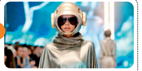
स्पेस का फैशन