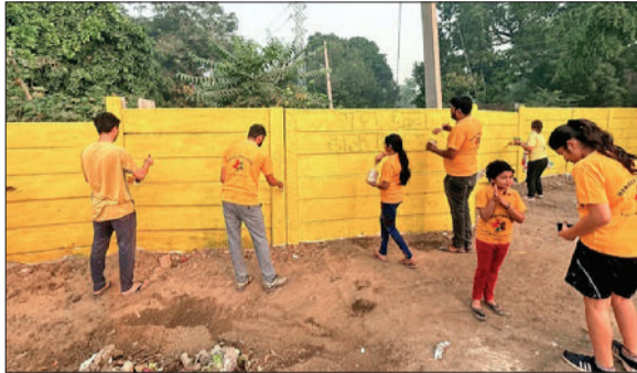
हिसार। दीवार पर पेंटिंग अभियान चलाते संस्था के सदस्य।