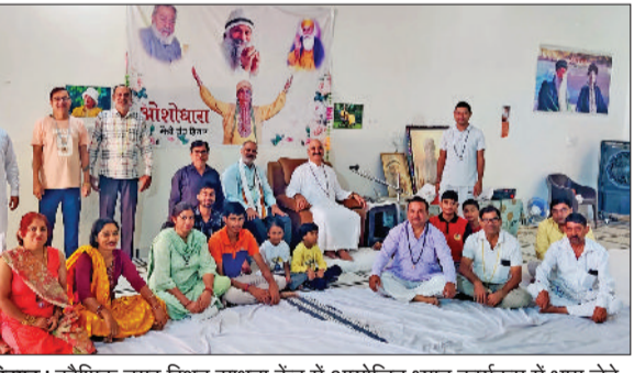
हिसार। कौशिक नगर स्थित साधना केंद्र में आयोजित ध्यान कार्यक्रम में भाग लेते साधक।