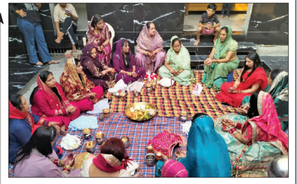
हिसार। करवा चौथ पर कथा सुनती महिलाएं।

उठा। तिरुपति धाम में 24 अक्टूबर तक ब्रह्मोत्सव चलेगा। यहां हर रोज सुबह व सायं सवारी निकाली जा रही है। इसके साथ ही प्रतिदिन प्रातःकाल हवन-यज्ञ, विभिन्न प्रकार के द्रव्यों से भगवान का दिव्य अभिषेक, नाम संकीर्तन, भोग, आरती व गोष्ठी प्रसाद वितरण का विधान पूरा किया जा रहा है।