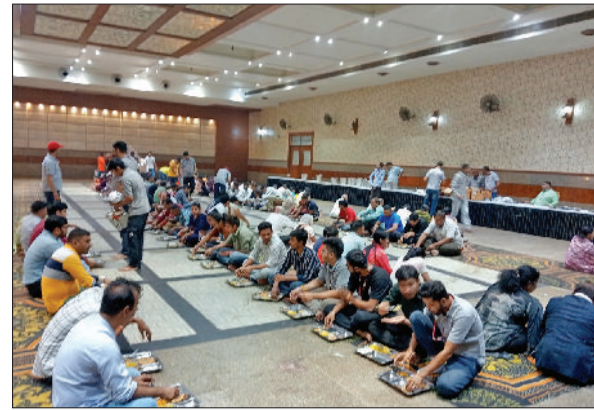
हिसार। भंडारे में प्रसाद ग्रहण करते श्रद्धालु।