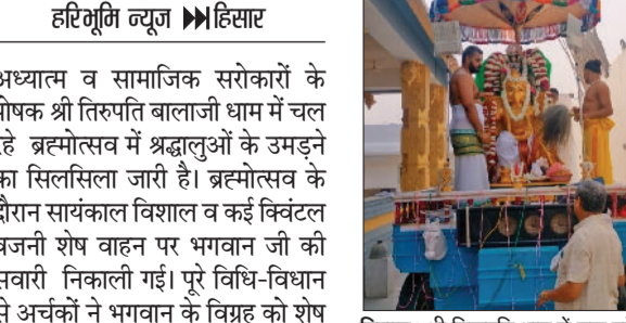
हिसार। श्री तिरुपति धाम में चल रहे ब्रह्मोत्सव में शेष वाहन की सवारी शोभा यात्रा में हिस्सा लेते श्रद्धालुगण।

अध्यात्म व सामाजिक सरोकारों के पोषक श्री तिरुपति बालाजी धाम में चल रहे ब्रह्मोत्सव में श्रद्धालुओं के उमड़ने का सिलसिला जारी है। ब्रह्मोत्सव के दौरान सायंकाल विशाल व कई क्विंटल वजनी शेष वाहन पर भगवान जी की सवारी निकाली गई। पूरे विधि-विधान से अर्चकों ने भगवान के विग्रह को शेष वाहन पर विराजमान किया और मंत्रोच्चारण के साथ शोभा यात्रा निकाली गई। इस दौरान भगवान का अद्भूत श्रृंगार देखकर श्रद्धालु भावविभोर हो गए। पूरा तिरुपति धाम भगवान वेंकटेश