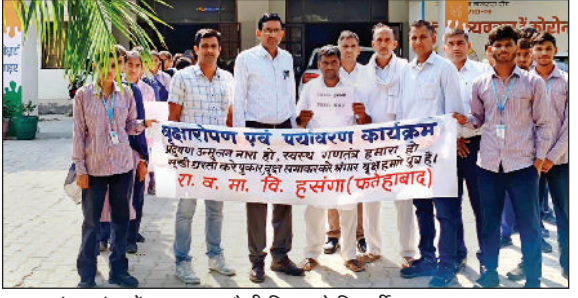
शुभा। गांव हसंगा में जागरूकता रैली निकालते विद्यार्थी।