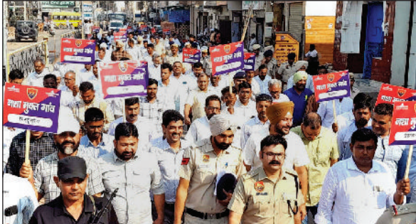
सिरसा। एसीपी नशा मुक्त घोषित 119 गांवों के सरपंचों तथा सामाजिक संगठनों के साथ शहर में रैली निकाल आमजन को नशे के खिलाफ जागरूक करते हुए।