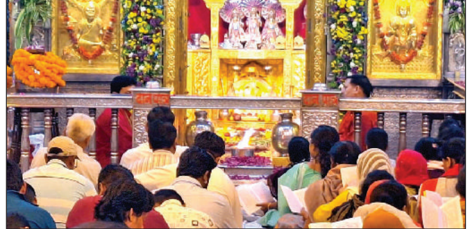
सिरसा। श्री सालासर मंदिर में श्री सुंदरकांड का पाठ करते श्रद्धालु।

सजाया। मंदिर के भीतर और बाहर श्रद्धालुओं की लंबी कतार लगी रही। इससे पूर्व बालाजी की भव्य श्रृंगार आरती की गई, जिसकी पावन ज्योत आयकर प्रबंध कमिटी की ओर से मंदिर की विशेष रूप से साज सजावट की गई थी। बाहर से बुलाए कारीगरों ने पूरे मंदिर को फूलों से