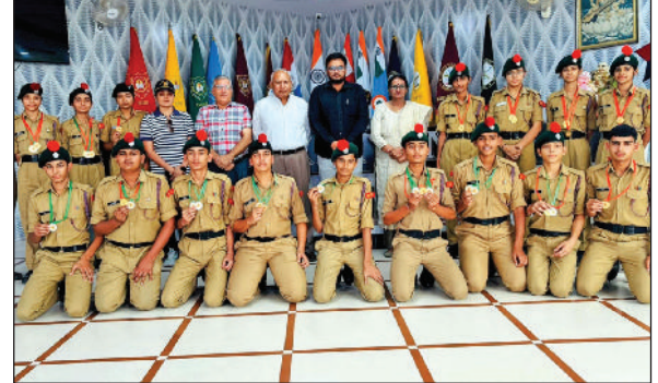
फतेहाबाद। प्रशिक्षण शिविर से लौटे रॉयल स्कूल खाराखेड़ी के एनसीसी कैडेट्स।