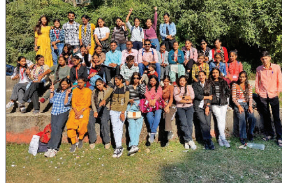
हिसार। डलहौजी में सामाजिक-आर्थिक सर्वे करके लौटे विद्यार्थी।

राजगढ़ रोड पर स्थित गुरु गोरखनाथ जी राजकीय महाविद्यालय के भूगोल विभाग के एमएससी. भूगोल अंतिम वर्ष के विद्यार्थियों ने हिमाचल प्रदेश के डलहौजी शहर के दो गांव कंगथला व बररा गांव का सामाजिक-आर्थिक सर्वे किया। विद्यार्थियों ने पहाड़ी क्षेत्रों के दुर्गम स्थानों पर रहने वाले लोगों के रहन-सहन, खान-पान, शिक्षा स्तर, महिलाओं का स्वास्थ्य तथा उनकी आर्थिक स्थिति के बारे में विस्तृत जानकारी प्राप्त