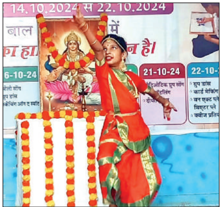
सिरसा। सोलो डांस में भाग लेती प्रतिभागी छात्रा।