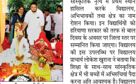
सिरसा। श्री श्याम बगीची में वर वधु की आशीर्वाद देते ट्रस्ट के पदाधिकारी।

मदर इंडिया कान्वेंट स्कूल के विद्यार्थियों ने सांस्कृतिक क्षेत्र में लहराया परचम। 16 और 18 अक्टूबर को बाल भवन फतेहाबाद में जिला स्तरीय बाल दिवस प्रतियोगिता का आयोजन किया गया, जिसमें मदर इंडिया कान्वेंट स्कूल रतिया से समूह एक में कक्षा 9 व 10वीं के विद्यार्थियों ने हरियाणवी सांस्कृतिक नृत्य में जिले से पंद्रह टीमों को पछाड़कर जिला स्तर पर प्रथम स्थान हासिल करके जोनल स्तर पर अपनी प्रतिभागिता दर्ज करवाई। दूसरी तरफ समूह 2 में विद्यालय से कक्षा 6 से 8 तक के बच्चों ने भाग लिया तथा सांत्वना पुरस्कार हासिल किया। समूह एक