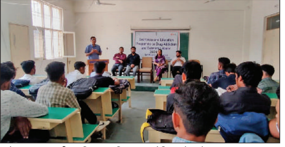
हरिभूमि न्यूज ▶▶ फतेहाबाद