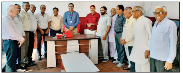
फतेहाबाद। एसबीआई पेंशनर्स एसोसिएशन की बैठक में मौजूद सदस्य।

गांव व क्षेत्र के लोगों के लिए बड़े ही हर्षोल्लास का विषय है कि हमारे विद्यालय के बच्चों का इतने अच्छे पदों पर चयन हुआ है। उन्होंने छात्रों के उज्वल भविष्य की कामना करते हुए क्षेत्र में शिक्षा के प्रसार आगे भी जारी रहेगा।