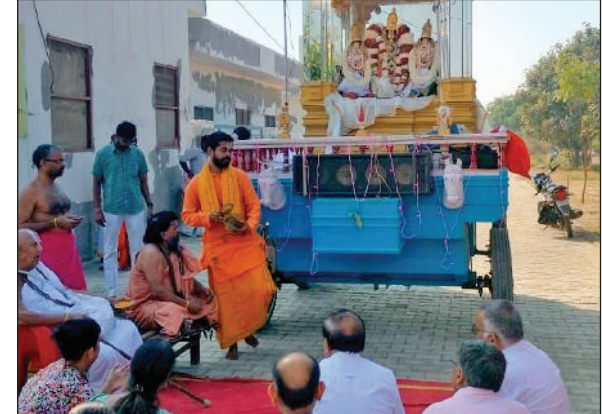
हिसार। श्री तिरुपति बालाजी धाम में ब्रह्मोत्सव के दौरान पूर्ण कोटी सवारी शोभा यात्रा में हिस्सा लेते श्रद्धालुगण।

भी पहुंचाता है जिससे व्यक्ति अनेक मानसिक बीमारियों का शिकार हो जाता है। उन्होंने नशे से जुड़ी बीमारियों के विषय में भी विस्तार से बताया और एचआईवी