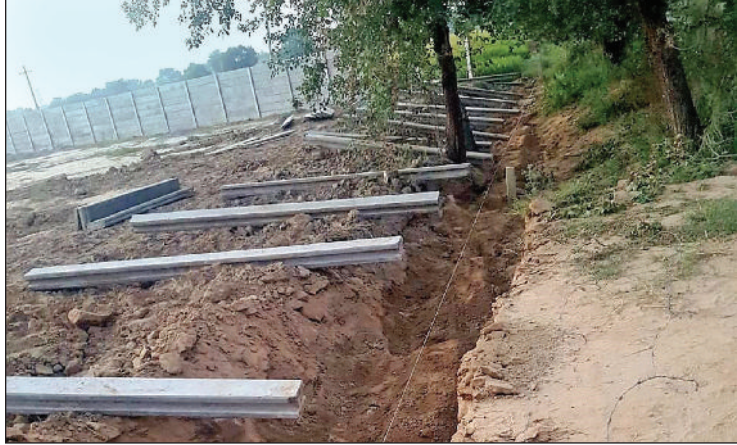
चेतावनी दी। कंपनी के मैनेजर को नोटिस मिलने के बाद हड़कंप मच गया।