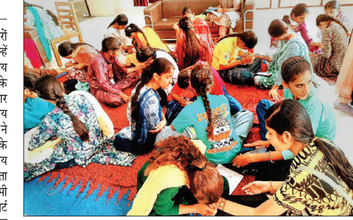
सिरसा। कार्यक्रम के दौरान महिला स्टाफ व छात्राएं मेहंदी लगाती।