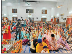
सोनीपत। कार्यक्रम में उपस्थित संगत।