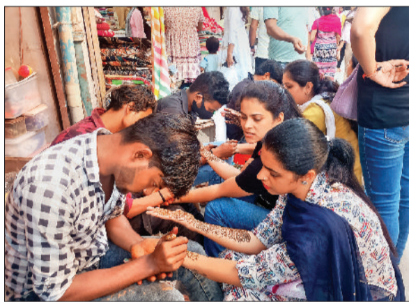
सोनीपत। करवाचौथ के मौके पर मेहंदी लगवाती महिलाएं।