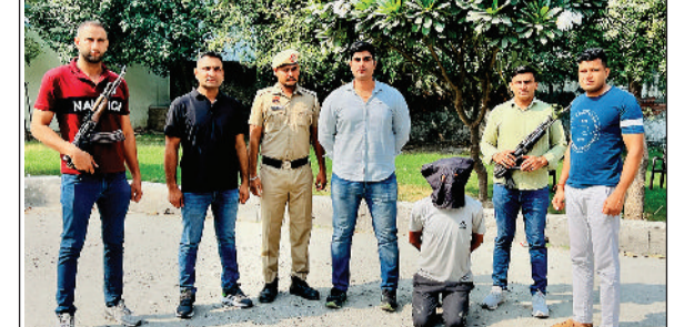
सोनीपत। गिरफ्तार आरोपित पुलिस टीम के साथ।