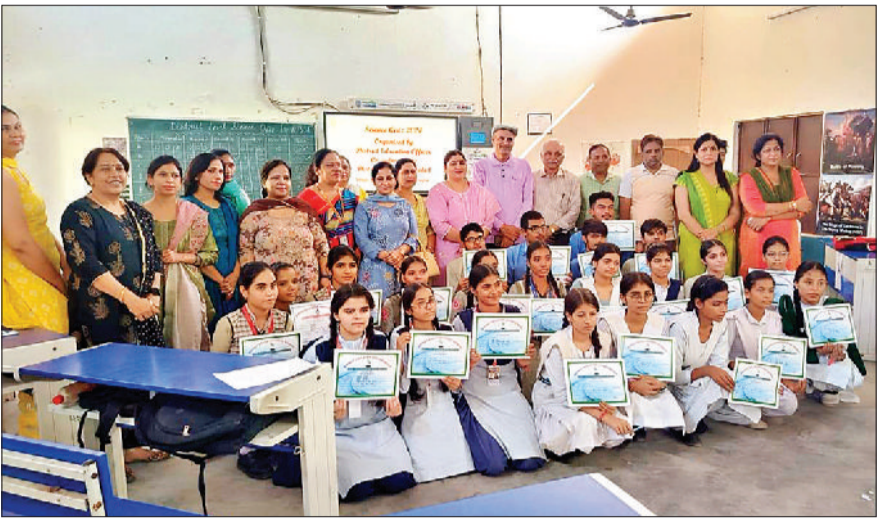
सोनीपत। प्रतियोगिता में हिस्सा लेने वाले प्रतिभागियों के साथ अतिथिगण एवं अन्य।