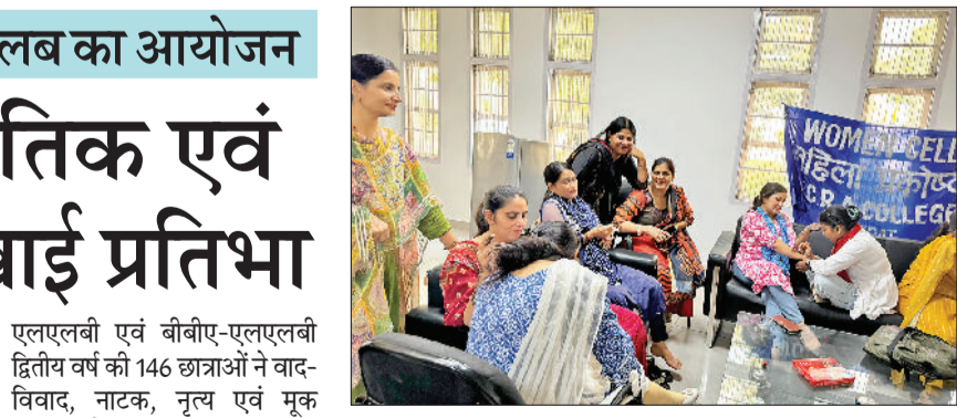
सोनीपत। प्रतियोगिता में हिस्सा लेते हुए प्रतिभागी विद्यार्थी।