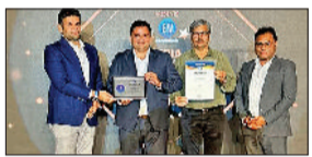
सोनीपत। त्रिभुक्तुल विद्यापीठ सोनीपत देवदू रोड को इंडिया स्कूल रैकिंग 2024-25 में हरियाणा के सोनीपत शहर, सर्वोच्च सम्मान रैंक -1से, सम्मानित किया गया।