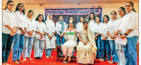
गोहाना। महिला विवि के विधि विभाग में आयोजित यूफोरिया के दौरान प्रस्तुति देती छात्राएं।

अपने संदेश में इस आयोजन के लिए छात्राओं की रचनात्मक प्रतिभा को आगे लाने और उनके आत्मविश्वास