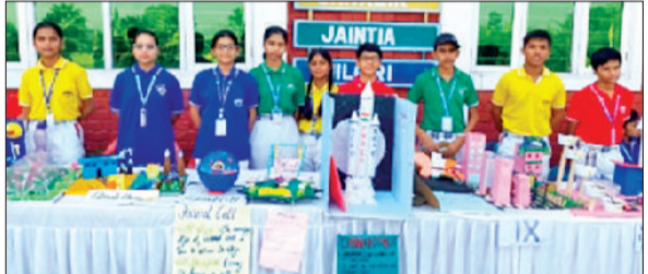
खरखोदा। द स्टैनफोर्ड स्कूल में प्रदर्शनी में प्रस्तुती देते विद्यार्थी।