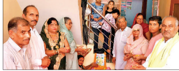
गोहाना। दोनों महान विभूतियों को नमन करते हुए मोचा के सदस्य।