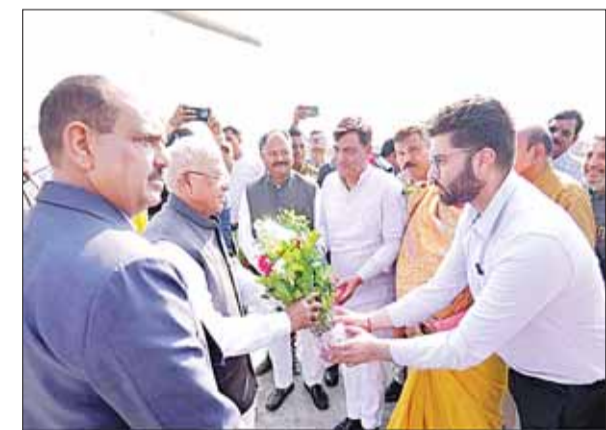
जिला पंचायत सीईओ ने भी किया राज्यपाल का अभिवादन।