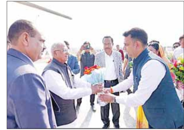
राज्यपाल का अभिवादन करते जिला कलेक्टर मण्डला।