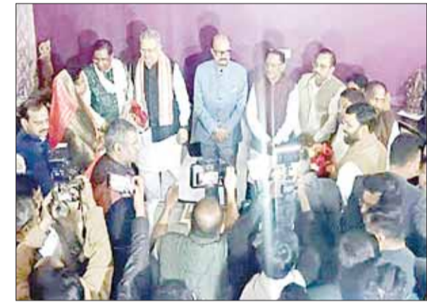
पूर्व मुख्यमंत्री छत्तीसगढ़ रमन सिंह।