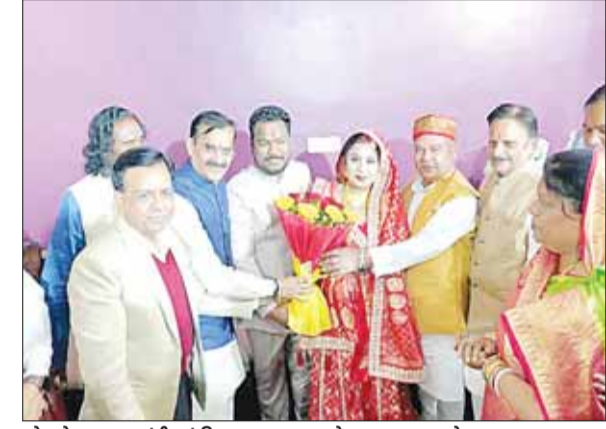
पदेश के उपमुख्यमंत्री एवं विधानसभा अध्यक्ष के साथ माजपा प्रदेश अध्यक्ष।