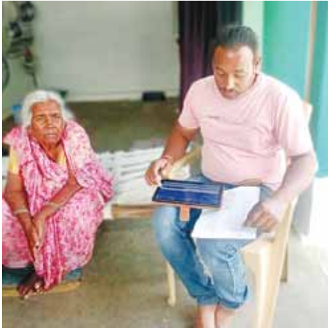
वरिष्ठ नागरिक जो निजी स्वास्थ्य बीमा योजनाओं या कर्मचारी राज्य बीमा (ईएसआई) योजना के अंतर्गत आते

हैं, वे भी आयुष्मान भारत प्रधानमंत्री जन आरोग्य योजना के तहत लाभ प्राप्त करने हेतु पात्र होंगे। आयुष्मान भारत प्रधानमंत्री जन आरोग्य योजना-नर्तगत पात्र वरिष्ठ नागरिकों का पंजीकरण राष्ट्रीय स्वास्थ्य प्राधिकरण के पोर्टल एवं आयुष्मान ऐप के माध्यम से किया जायेगा। वरिष्ठ नागरिक स्वयं भी अपना पंजीकरण वेब पोर्टल अथवा आयुष्मान ऐप के माध्यम से कर सकते हैं।