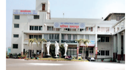
अभी नहीं हटाए जाएंगे स्वच्छता प्रमारी

भोपाल नगर निगम परिषद की बैठक 13 दिसंबर को सुबह 11 बजे से होगी। एमआईसी से मंजूरी 21 मुद्दों के प्रस्ताव को परिषद बैठक में रखेंगे। नियमानुसार दो महीने में बैठक होनी चाहिए, लेकिन यह 3 महीने के बाद होगी। इसलिए बैठक हंगामेदार होने के आसार हैं। क्योंकि विपक्ष हंगामा कर सकता है।