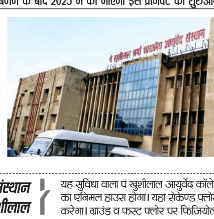
पहला आयुर्वेद संस्थान होगा खुशीलाल

एक बार संस्थान तैयार होने और उसमें विशेषज्ञों के साथ सभी जरूरी इतिवपमेंट होने के बाद अंतिम और आवश्यक प्रक्रिया शुरू की जाएगी। इसमें सबसे पहले एनिमल वेलफेयर बोर्ड को लाइसेंस के लिए एप्लीकेशन दी जाएगी। यहां का टीम आकर निरीक्षण करेगी। इनकी सहमती के बाद ही एनिमल हाउस खोला जा सकेगा। यहां रहने वाले एनिमल को उपचार, पानी, पेड़-पौधे आदि सुविधाएं होना अनिवार्य है। तभी इसकी परमिशन मिल सकेगी।