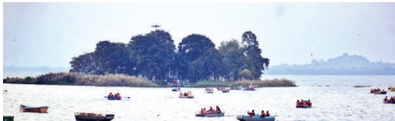
रविवार को बोट वलब पर्यटकों से गुलजार रहा।