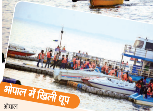
भोपाल में खिली धूप

भोपाल में पिछले 24 घंटे में दिन के तापमान में हल्की गिरावट आई है। शनिवार को दिन का तापमान 27.8 डिग्री सेल्सियस रिकॉर्ड किया गया। रात का तापमान भी 2 डिग्री सेल्सियस रिकॉर्ड किया गया। यह सामान्य से फिर भी 2 डिग्री ज्यादा है।