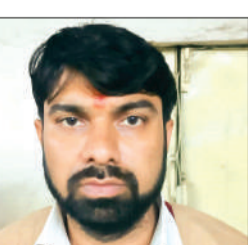
पोर्न मूवी देखने का था शौकीन पुलिस ने आरोपी को गिरफ्तार कर उसका मोबाइल जब्त किया तो पता चला कि उसके मोबाइल डेटा सारे पोर्न वीडियो ► शेष पेज 4 पर

आरोपी के खिलाफ छेड़छाड़, दुष्कर्म और पाक्सो एक्ट सहित अन्य धाराओं में प्रकरण दर्ज किया