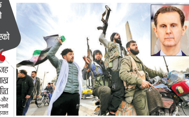
राष्ट्रपति असद भागकर रूस पहुंचे, पुतिन ने दी राजनीतिक शरण सीरिया के राष्ट्रपति बशर अल-असद देश छोड़कर रूस भाग गए हैं। रूस के राष्ट्रपति व्लादिमीर पुतिन ने असद और उनके परिवार को राजनीतिक शरण दे दी है। पहले अटकलें लगाई जा रही थीं कि असद के विमान का रडार से संपर्क टूट गया है। ► शेष पेज 4 पर

लोगों ने राष्ट्रपति भवन लूटा, टैंकों पर चढ़कर जश्न मना रहे विद्रोही, सीरिया के चार शहरों अलेप्पो, हमा, होमस और दारा पर विद्रोहियों का कब्जा