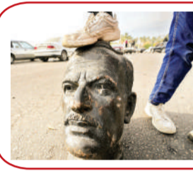
दमिश्क/नई दिल्ली

सीरिया के राष्ट्रपति बशर अल-असद देश छोड़कर भाग चुके हैं। सेना ने असद के देश छोड़ने की पुष्टि करते हुए कहा कि राष्ट्रपति की सत्ता खत्म हो चुकी है। सीरिया में पिछले 11 दिनों से विद्रोही गुटों और सेना के बीच कब्जे के लिए लड़ाई चल रही थी। विद्रोही लड़ाकों ने रविवार को राजधानी दमिश्क पर कब्जा कर लिया है। असद के देश छोड़ने के बाद सीरियाई पीएम ने विद्रोहियों को सत्ता सौंपने का प्रस्ताव दिया है। पीएम मोहम्मद गाजी अल जलाली ने एक वीडियो में कहा है कि वो देश में ही रहेंगे और जिसे भी सीरिया के लोग चुनेंगे, उसके साथ मिलकर काम करेंगे। ► शेष पेज 4 पर