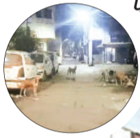
शिकायत करने पर आते हैं, लेकिन खाली मूलाते रहते हैं डॉंग स्ववाड वाहन

नगर निगम का डॉंग स्ववाड आजकल कई बार शिकायत करने के बाद भी आवारा कुत्तों को पकड़ने नहीं आता। कई बार दवाब बनाने के बाद अगर कुत्ते पकड़कर भी ले गया तो वो दूसरे मोहल्ले में छोड़ देता है। जबकि इस मामले में डॉंग स्ववाड टीम से बात की तो उनका कहना है कि आवारा कुत्तों को पकड़कर रखने की कोई व्यवस्था नहीं है। इसलिए जिस मोहल्ले से नसबंदी के लिए कुत्तों का पकड़ा जाता है। उसी मोहल्ले में छोड़ना होता है। यह हो सकता है कि गलती से दूसरे मोहल्ले के आवारा कुत्ते दूसरे में छोड़ दिए हों।