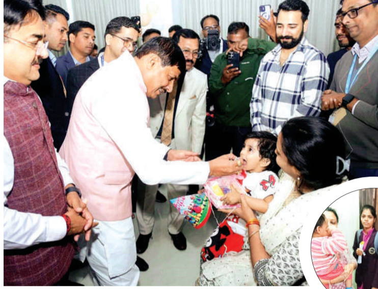
सीएम हाउस में बच्चों को पोलियो ड्रॉप पिलाकर अभियान का शुभारंभ करते मुख्यमंत्री।