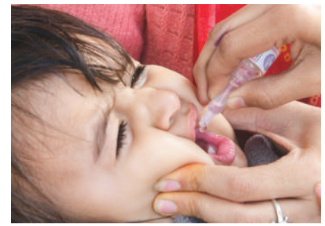
जयप्रकाश चिकित्सालय में एक बच्चे को दवा पिलाते कर्मचारी।