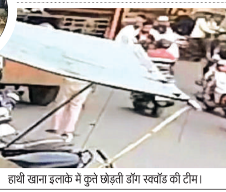
हाथी खाना इलाके में कुत्ते छोड़ती डॉंग स्ववाड की टीम।