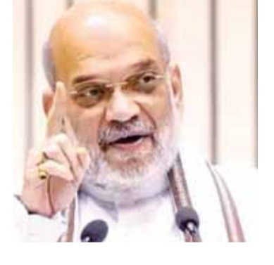
एजेसी कोडा पावुरुरु

केंद्रीय गृह मंत्री अमित शाह ने रविवार को आंध्र प्रदेश के गन्नावरम मंडल के कोडा पावुरुरु में 10वीं बटालियन एनडीआरएफ परिसर और एनआईडीएम दक्षिणी परिसर का उद्घाटन किया। इस दौरान आंध्र प्रदेश के सीएम चंद्रबाबू नायडू भी मौजूद रहे। कार्यक्रम में केंद्रीय गृह मंत्री अमित शाह ने कहा कि जब कोई आपदा भगवान द्वारा भेजी जाती है, तो एनडीआरएफ मदद के लिए आती है। महाराष्ट्र और हरियाणा में भारी जीत के बाद एनडीए 2025 में दिल्ली में सरकार बनाएगी। केंद्रीय गृह मंत्री ने कहा कि 2014 से 2019 के बीच संभावनाओं से भरा राज्य आंध्र प्रदेश मानव निर्मित आपदा के कारण पीड़ित रहा। अब आपको उन बर्बाद हुए पांच वर्षों के बारे में चिंता करने की जरूरत नहीं है। पीएम मोदी और सीएम नायडू की जोड़ी यहां विकास की रफ्तार को तीन गुना तेज करेगी। नरेंद्र मोदी सरकार आंध्र प्रदेश के विकास के लिए चंद्रबाबू नायडू के साथ चट्टान की तरह खड़ी है।