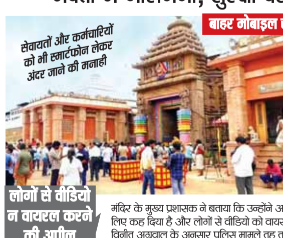
बाहर मोबाइल स्टैंड लगाए गए, 1,000 जुमाना