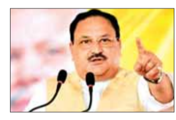
'भारतीय राज्य' पर नेता प्रतिपक्ष को नसीहत दी

अहमदाबाद। केंद्रीय मंत्री और भाजपा अध्यक्ष ने भाजपा के 'संविधान गौरव अभियान' में कहा कि राहुल गांधी को इतिहास की जानकारी नहीं है। राहुल को पता ही नहीं है कि उनके पिता, दादी, परदादा ने संविधान के साथ कैसे छेड़छाड़ की थी। नड्डा का ये बयान राहुल के उस बयान पर पलटवार के तौर पर देखा जा रहा है, जिसमें उन्होंने कहा था कि भाजपा और आरएसएस ने इस देश की हर एक संस्था पर कब्जा कर लिया है। अब हम भाजपा, आरएसएस और भारतीय राज्य से ही लड़ रहे हैं। उन्होंने कहा कि कांग्रेस ने 65 वर्षों तक देश पर शासन किया और उसके नेताओं ने संविधान के साथ छेड़छाड़ की। संविधान के बुनियादी धारणाओं को भी नष्ट करने की कोशिश की। नड्डा ने कहा कि आज हमारे कांग्रेस नेता कहते हैं कि 'भारतीय राज्य के खिलाफ लड़ रहे हैं।' उन्हें इतिहास का कोई ज्ञान नहीं है।