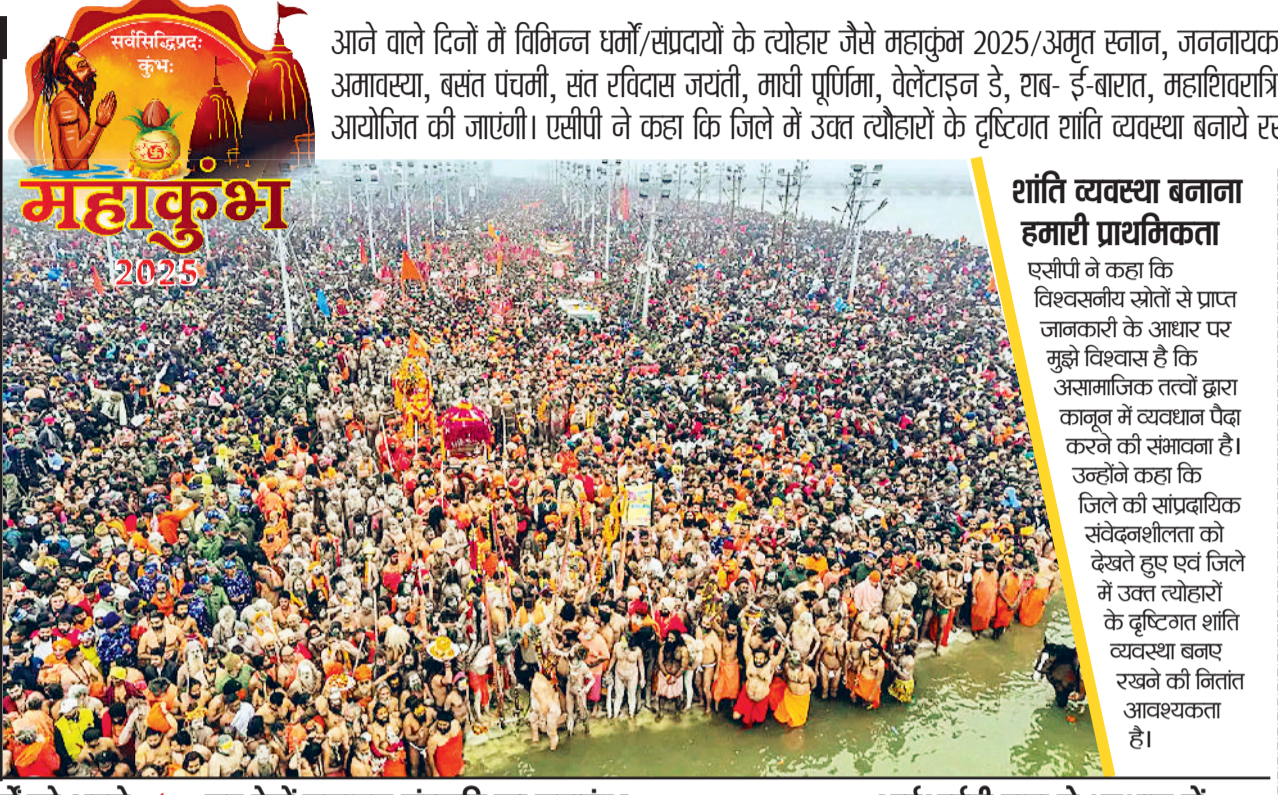
महाकुंभ में कानून और व्यवस्था बनाए रखने के लिए 28 फरवरी तक निषेधाज्ञा रहेगी लागू, व्यवधान किया तो होगी कड़ी कार्रवाई