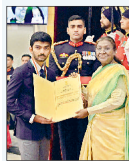
एजेसी नई दिल्ली

राष्ट्रपति द्रौपदी मुर्मू ने शुक्रवार को नई दिल्ली स्थित राष्ट्रपति भवन में राष्ट्रीय खेल पुरस्कार 2024 प्रदान किए। इस दौरान खेल मंत्री मनसुख मांडविया भी मौजूद रहे। इस दौरान राष्ट्रपति भवन में आयोजित समारोह में विश्व शतरंज चैंपियन डी. गुक्ता, पेरिस ओलंपिक में दो पदक जीतने वाली पिस्टल निशानेबाज मनु भाकर, भारतीय हॉकी टीम के कप्तान हरमनप्रीत >>> श्रेष्ठ पेज 5 पर