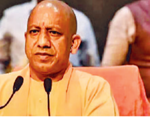
योगी सरकार ने जल जीवन मिशन के तहत सोलर ऊर्जा का उपयोग कर न केवल पर्यावरण संरक्षण को प्रोत्साहन दिया है, बल्कि ग्रामीण और पिछड़े क्षेत्रों में