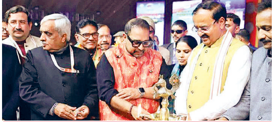
डिप्टी सीएम मौर्य ने महादेवन की देश के प्रति समर्पण भाव की प्रशंसा की

एजेसी ▶▶ प्रयागराज महाकुंभ में संगीत और संस्कृति प्रेमियों को जब फिल्मों के सुविख्यात गायक मिल जायें तो खिल उठते हैं मनोभाव। अवसर महाकुंभ जैसे आयोजन का हो तो बात कुछ खास हो जाती है। संस्कृति विभाग के गंगा पंडाल में गुरुवार को हिंदी सिनेमा के पार्श्व गायक और संगीतकार शंकर महादेवन के सुमधुर गीतों ने श्रोताओं को आनंदित कर दिया। गणेश वंदना से शुरुआत कर उन्होंने भक्तिमय गीत प्रस्तुत किया और समापन शिव तांडव स्रोत से किया। महाकुंभ की आभा देश दुनिया में फैलने की चर्चा करते हुए शंकर महादेवन ने इसे अद्भुत बताया। अपने जीवन का इसे अभूतपूर्व बताते हुए कहा कि प्रथामंत्री नरेंद्र मोदी और मुख्यमंत्री योगी आदित्यनाथ की धर्म के प्रति सकारात्मक सोच से यह संभव हो पाया है।