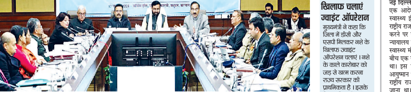
हरिभूमि ब्यूरो नई दिल्ली

हरियाणा के मुख्यमंत्री नायब सिंह सैनी ने डंकी रूट के माध्यम से प्रदेश के युवाओं को विदेश भेजने वालों की पहचान कर कड़ी कार्रवाई करने के निर्देश दिए गए हैं ताकि कोई भी युवाओं के भविष्य से खिलवाड़ न कर सके। साथ ही चिट फंड व अन्य तरीके से लोगों का पैसा कई गुणा करने का झांसा देने वालों पर सख्त कार्रवाई के निर्देश देते हुए कहा कि यदि कोई अनियमित तरीके से पैसा जमा कराने की योजना संचालित करता है, तो उसके द्वारा खरीदी गई सम्पत्ति की रजिस्ट्री पर बैन लगाने का फैसला भी लिया गया है। मुख्यमंत्री नायब सिंह सैनी ने शुक्रवार को प्रदेश के सभी उपायुक्तों और पुलिस अधीक्षकों को आयोजित संयुक्त बैठक की अध्यक्षता कर उन्हें कानून व्यवस्था, महिलाओं के विरुद्ध