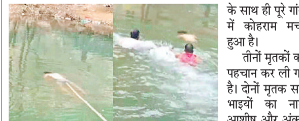
एजेसी ▶▶ रांची

झारखंड के रांची से दर्दनाक घटना सामने आई है। यहां के बुढ़मू प्रखंड के तिरु फॉल में नहाने गए तीन दोस्तों की डूबने से मौत हो गई। मृतकों में से दो सगे भाई थे। दोनों सगे भाई रांची के रहने वाले थे। इनमें से एक गुरुग्राम में नौकरी करता था, जबकि दूसरा भाई रांची में आईएचएम में पोस्टेड था। तीसरा मृतक युवक चान्नी करकट का रहने वाला था। दो भाइयों के साथ तीन लोगों की मौत की खबर से परिवार