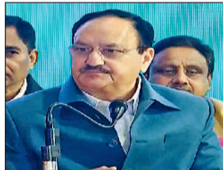
हरिभूमि ब्यूरो नई दिल्ली

विधवाओं एवं बेसहारा महिलाओं को पेंशन को भी बढ़ाकर 3,000 रुपए किया जाएगा 60 से 70 वर्ष के बुजुर्गों को वृद्धा पेंशन 2 हजार से बढ़ाकर 2500 रुपए प्रति माह माह और 70 वर्ष से अधिक के वरिष्ठ नागरिकों का पेंशन भी बढ़ाकर 3,000 रुपए किया जाएगा गर्भवती महिलाओं को पेंशन भी बढ़ाकर 3,000 रुपए प्रति माह तक का इलाज मुफ्त होगा। गर्भवती महिलाओं को मुख्यमंत्री की ओर से 21 हजार रुपए दिए जाएंगे आम आदमी पार्टी के मोहल्ला क्लिनिकों में करीब 300 करोड़ रुपए का घोटाला हुआ : नड्डा कहा, कांग्रेस और आम आदमी पार्टी अपने झूठे वादे और जनता के साथ विश्वासघात करने के लिए जानी जाती है