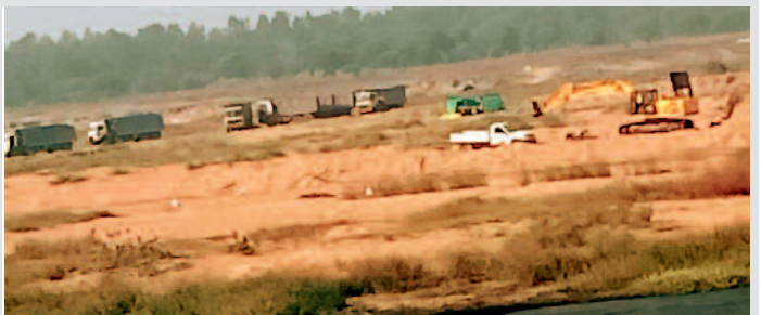
सख्त कार्रवाई की जाएगी

पारागांव में रेत का अवैध खनन और परिवहन का एक विडियो वायरल हुआ है। इस विडियो में स्पष्ट रूप से दिखाई दे रहा है कि खदान में किस तरह से माफिया के लोग चैन माउंटन मशीनों से रेत का खनन कर हाईवा गाड़ियों में लोडिंग कराकर रवाना कर रहे हैं। यह विडियो दो दिन पुराना बताया जा रहा है। इस विडियो में आधा दर्जन से अधिक हाईवा गाड़ियां कतार में चलती दिखाई दे रही हैं, वहीं बोलरो में मशीन से रेत की लोडिंग की जा रही है। सूत्रों के अनुसार विडियो को आसपास गांव के किसी व्यक्ति ने बनाकर वायरल किया है। ऐसी भी खबर है कि विडियो वायरल होने के बाद अवैध खनन की सूचना जिला प्रशासन एवं संबंधित विभाग में दी गई है, जिसके बाद विभाग जांच कर कार्रवाई करने की तैयारी में है।