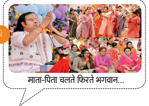
माता-पिता चलते फिरते भगवान...