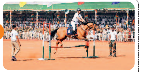
सुरक्षा बलों ने मार्च पास्ट संग दी तिरंगे ....