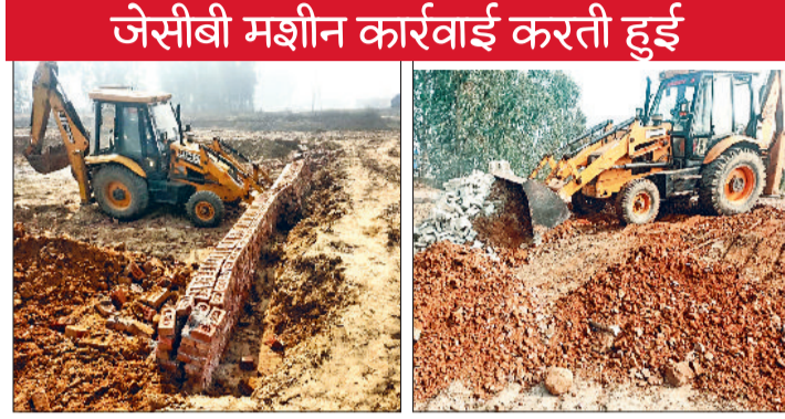
जेसीबी मशीन कार्रवाई करती हुई