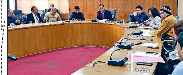
रोहतक। सामान्य प्रवेश परीक्षा के संदर्भ में सुपवा, पंडित बीडी शर्मा स्वास्थ्य विज्ञान विश्वविद्यालय, महाविद्यालयों तथा शिक्षा विभाग के अधिकारियों की बैठक लेते उपयुक्त।

की थी। हाई कोर्ट की डिविजन बेंच ने सरकार की अपील को खारिज करते हुए कहा कि क्रोनिक बीमारी के मरीजों को लगातार इलाज की जरूरत होती है। क्रोनिक किडनी डिजीज जैसी बीमारी से पीड़ित मरीज को दिला का दौरा या स्ट्रोक जैसी गंभीर समस्याओं का खतरा बढ़ जाता है। कोर्ट ने कहा कि सरकार ने यह स्वीकार किया कि इलाज किसी स्वीकृत अस्पताल में हुआ था। इसलिए केवल ओपीडी में इलाज होने के आधार पर मेडिकल प्रतिपूर्ति से इनकार करना अनुचित है। हरियाणा सरकार को मेडिकल प्रतिपूर्ति नीति के अनुसार, आपातकालीन स्थिति में अस्वीकृत अस्पताल में इलाज लेने पर ही खर्च की भरपाई नहीं की जा सकती। लेकिन इस मामले में मरीज ने स्वीकृत अस्पताल में इलाज करवाया था। कोर्ट ने कहा कि क्रोनिक बीमारी वह स्थिति होती है जो लंबे समय तक बनी रहती है और पूरी तरह से ठीक नहीं होती। मरीज अन्य बीमारियों के भी ज्यादा खतरे में होता है। इस आधार पर कोर्ट ने हरियाणा सरकार की अपील खारिज करते हुए कोर्ट ने एकल बेंच के आदेश को बरकरार रखा। हाई कोर्ट के इस फैसले से हरियाणा के हजारों कर्मचारियों को राहत मिलेगी जो क्रोनिक बीमारी का ओपीडी में इलाज करवाने पर प्रतिपूर्ति नहीं हो पाते।