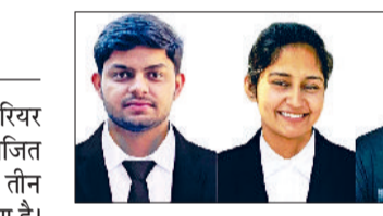
एमडीयू में कैम्पस प्लेसमेंट ड्राइव में विजित की थी। इमर्सर के विद्यार्थियों के लिए आयोजित इस