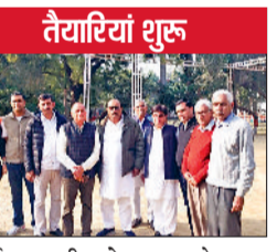
कार्यक्रम की शोभा बढ़ाने जाट शिक्षण संस्था में पधार रहे हैं। दिमाना ने चौधरी छोट्टाराम के 144वें जन्मोत्सव की तैयारियों को लेकर शिक्षण संस्था के स्कूल व कॉलेजों के प्रिंसिपल, स्टाफ सदस्यों, छोट्टाराम जन्मोत्सव समिति के पदाधिकारियों को कार्यक्रम को सफल बनाने के भी दिशा-निर्देश दिए।

जाट शिक्षण संस्था द्वारा 31 जनवरी को जाट कॉलेज में आयोजित होने वाले चौधरी छोट्टाराम के 144वें जन्मोत्सव समारोह में मुख्य अतिथि के तौर पर हरियाणा के मुख्यमंत्री नायब सिंह सैनी पधार रहे हैं। जाट शिक्षण संस्था के प्रधान गुलाब सिंह दिमाना ने यह जानकारी दी। समारोह की तैयारियों का जायजा लेते हुए बताया कि मुख्यमंत्री नायब सिंह सैनी के साथ अति विशिष्ट अतिथि के तौर पर प्रदेश के शिक्षामंत्री महिपाल ढांडा आएंगे। इस दौरान कई अतिविशिश्ट व विशिष्ट अतिथि भी