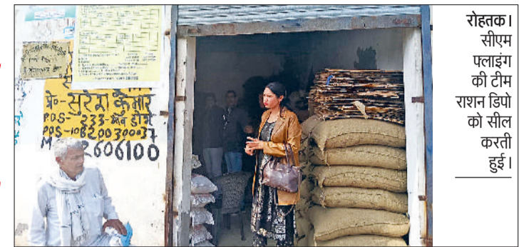
रोहतक। सीएम फ्लाईंग की टीम राशन डिपो को सील करती हुई।