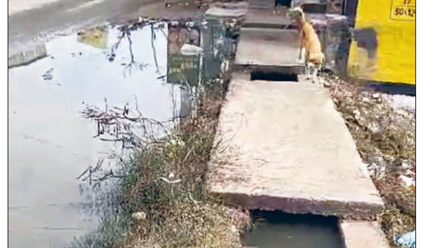
गन्नीर। नाले ओवरफ्लो होने के कारण सड़क पर भरा हुआ दूषित पानी।