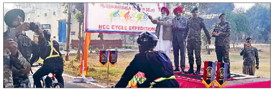
सोनीपत। साइकिल अभियान को रवाना करते हुए।