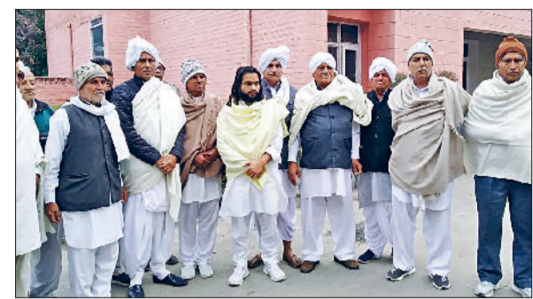
खरखोदा। मीट की दुकानों को बंद करने की मांग करते खाप प्रतिनिधि।