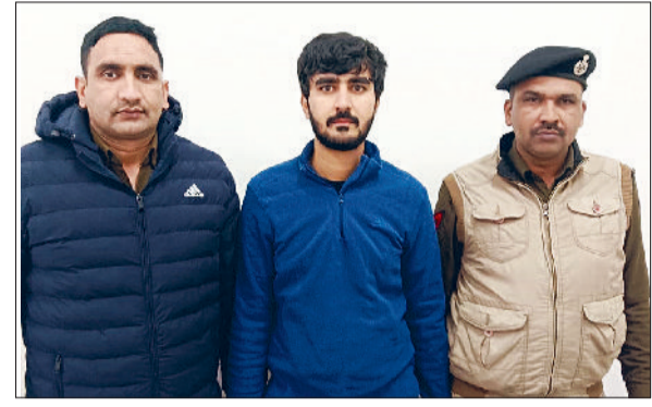
खरखोदा। पुलिस की गिरफ्त में आरोपी युवक।