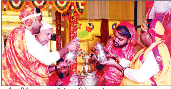
गन्नीर। तीर्थकर पर कलशों से जन्माभिषेक करते श्रद्धालु।

रोहताक। महर्षि दयानंद विवि में सेंटर फॉर डिस्टेंस एंड ऑनलाइन एजुकेशन द्वारा ओपन एंड डिस्टेंस लर्निंग तथा ऑनलाइन मोड के माध्यम से संचालित यूजी/पीजी के इंटरमीडिएट पाठ्यक्रमों में जनवरी-फरवरी 2025 में एडमिशन के लिए अभ्यर्थी 10 फरवरी तक बिना विलंब शुल्क के ऑनलाइन आवेदन कर सकते हैं। एमडीयू के ऑनलाइन आवेदन कर सकते हैं। एमडीयू के ऑनलाइन आवेदन कर सकते हैं। एमडीयू के ऑनलाइन आवेदन कर सकते हैं।