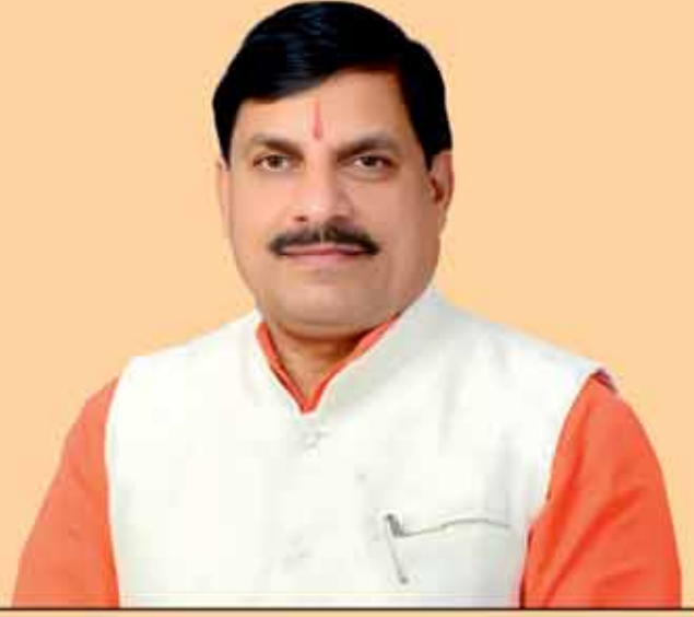
डॉ. मोहन यादव, मुख्यमंत्री