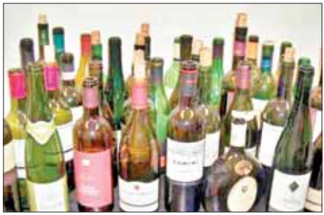
एकल समूह में 2 से 5 दुकानों का ठेका लेने वाले छोटे टेकेदार सामने नहीं आ रहे हैं।

शराब कारोबार से जुड़े सूत्रों का कहना है कि सरकार की नई आबकारी नीति टेकेदारों को रास नहीं आ रही है. अब सरकार की ओर से की आनलाईन बोली की प्रक्रिया की जाएगी. जिसमें जिले स्तर पर शराब के ठेके नीलाम होंगे. लेकिन अब प्रदेश में जिला स्तर पर ठेका लेने वाले बड़े टेकेदार बहुत कम ही शराब व्यवसाय में दिलचस्पी रख रहे हैं. लिहाजा