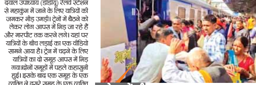
एजेसी नई दिल्ली

उत्तर प्रदेश के चंदौली जिले के दीन दयाल उपाध्याय (डीडीयू) रेलवे स्टेशन से महाकुंभ में जाने के लिए यात्रियों की जमकर भीड़ उमड़ी। ट्रेनों में बैठने को लेकर लोग आपस में मिड़ जा रहे हैं और मारपीट तक करने लगे। यहां पर यात्रियों के बीच लड़ाई का एक वीडियो सामने आया है। ट्रेन में चढ़ने के लिए यात्रियों का दो समूह आपस में मिड़ गया। दोनों समूहों में पहले कहासुनी हुई। इसके बाद एक समूह के एक व्यक्ति ने दूसरे समूह के एक व्यक्ति को पीट दिया। हालांकि, जैसे ही दूसरे समूह के लोगों की नजर मारपीट करने पर पड़ी तो उन्होंने मिलकर पहले समूह के लोगों को पीट दिया।