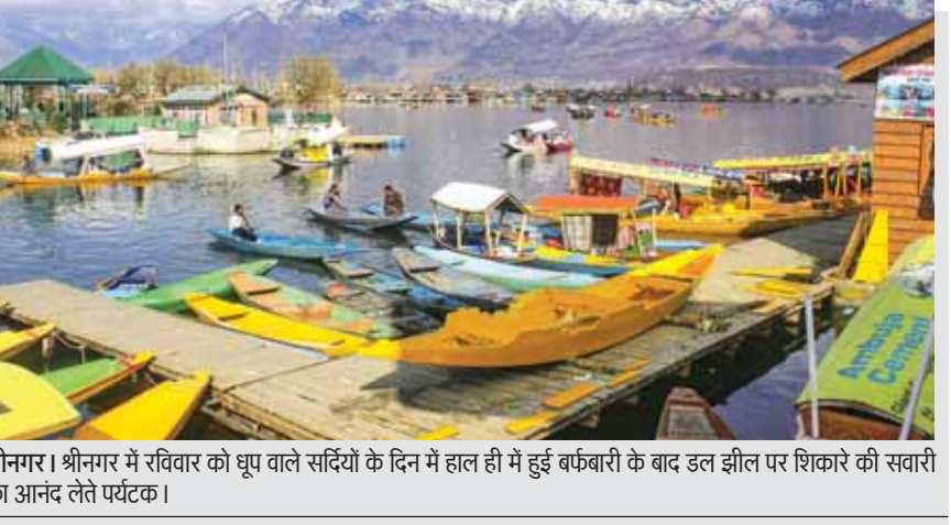
श्रीनगर। श्रीनगर में रविवार को घूब वाले सदियों के दिन में हाल ही में हुई बर्फबारी के बाद डल झील पर शिकारे की सवारी का आनंद लेते पर्यटक।