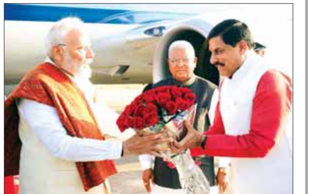
स्टेट हैंगर पर सीएम ने पीएम मोदी का आत्मीय स्वागत किया।

मोदी ने संत महात्माओं से कहा कि हालांकि आप बीमार नहीं होंगे फिर भी आप सबको भी आयुष्मान कार्ड बनवाना चाहिए।