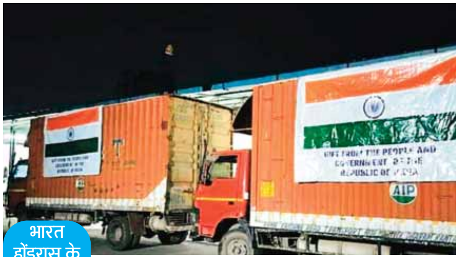
भारत और होंडुरास के बीच मैत्रीपूर्ण और सौहार्दपूर्ण संबंध रहे हैं। होंडुरास जब कोविड संकट से जूझ रहा था, तब भारत सरकार ने होंडुरास को आवश्यक दवाइयाँ और पीपीई दान किए थे। इसी तरह, पहले भी कई चुनौतीपूर्ण समयों के दौरान भारत सरकार ने होंडुरास की मदद की है।