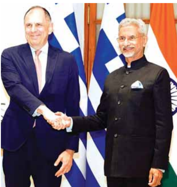
डॉ. एस. जयशंकर से ग्रीस के विदेश मंत्री जॉर्ज जेरापेट्रिटिस ने मुलाकात की।

भारत-यूरोपीय संघ के रिश्तों को आगे ले जाने में मदद करेगा ग्रीस