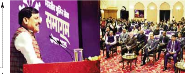
कार्यक्रम में आईपीएस अफसरों को संबोधित करते सीएम

डीजीपी बोले मप्र पुलिस को गृहमंत्री शाह और गृह सचिव से मिली सराहना