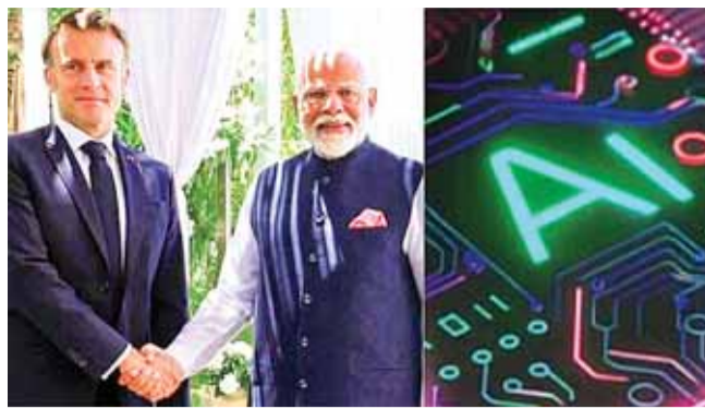
वहीं भारत मार्सिले में एक नया वाणिज्य दूतावास खोलने के लिए तैयार है, जो दक्षिणी फ्रांस में अपनी राजनयिक उपस्थिति को और मजबूत करेगा। इस कदम से भारत और फ्रांस के बीच व्यापार, सांस्कृतिक और लोगों से लोगों के बीच संबंधों को बढ़ाने की उम्मीद है।

एआई के विकास को समावेशी दृष्टिकोण मिलेगा