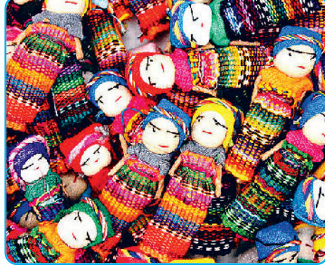
ग्वाटेमाला की वरी डॉल्स

घिरा रहता है, तो वरी डॉल उसे राहत पहुंचाती है। ग्वाटेमाला की यह गुड़िया, घर में उपलब्ध सामग्रियों से बनाई जा सकती है। इसे अकसर रद्दी कपड़ों, पतली छड़ियों, सैंक, तार, धागे आदि की सहायता से बनाया जाता है। इसे बनाने का कोई