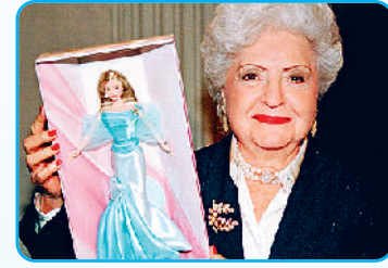
एक्टर मर्लिन मुनरो से इन्स्पिरेशन थी। धीरे-धीरे बाबी डॉल्स लोगों, खासकर बच्चों के बीच पॉपुलर होने लगी। आज बाबी दुनिया की सबसे अधिक पसंद की जाने वाली डॉल है।

बच्चों, तुम सब की चहेती बाबी डॉल का निर्माण अमेरिका की बिजनेस वूमन रूथ हैडलर ने 1959 में किया था। उनका यही उद्देश्य था कि छोटी बच्चियां, इन्हें देखकर अपने सुंदर भविष्य की कल्पना करें। पहली बाबी डॉल ने चमकीले लाल होंठों के साथ एक स्मार्ट काले और सफेद धारीदार छोटी पोशाक पहनी थी, जो हॉलीवुड एक्टर मर्लिन मुनरो से इन्स्पिरेशन थी। धीरे-धीरे बाबी डॉल्स लोगों, खासकर बच्चों के बीच पॉपुलर होने लगी। आज बाबी दुनिया की सबसे अधिक पसंद की जाने वाली डॉल है।