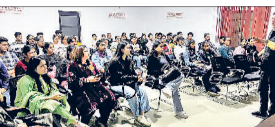
अंबाला। कार्यशाला के दौरान मौजूद छात्र व मुख्य वक्ता।