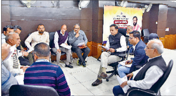
पानीपत। चुलकाना धाम फाल्गुनी मेले को लेकर बैठक करते अधिकारी।