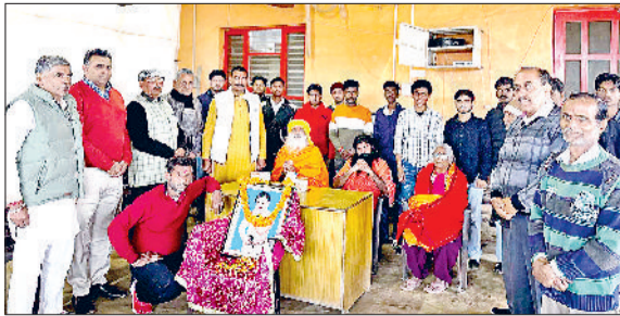
अंबाला। अमर शहीद चंद्रशेखर को श्रद्धांजलि देते सामाजिक संस्थाओं के पदाधिकारी।