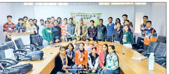
अंबाला। विज्ञान दिवस पर मौजूद छात्र-छात्राएं।