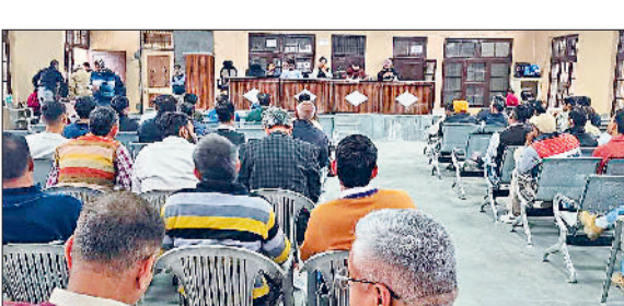
इंद्री। बीडीपीओ कार्यालय इंद्री में पोलिंग पार्टियों को वोटिंग करवाने के लिए प्रशिक्षण देते अधिकारी।

हो तो संबंधित उच्च अधिकारी के संज्ञान में लेकर आए। उन्होंने पोलिंग पार्टियों को निर्देश दिए कि वे ईवीएम मशीन की अच्छी तरह से