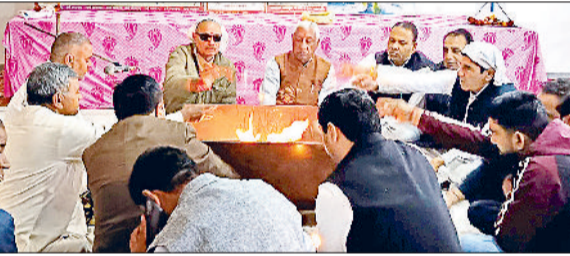
इंद्री। भारत नवनिर्माण सेना हरियाणा की ओर से शहीद चंद्रशेखर आजाद के बलिदान दिवस पर हवन यज्ञ करते हुए।