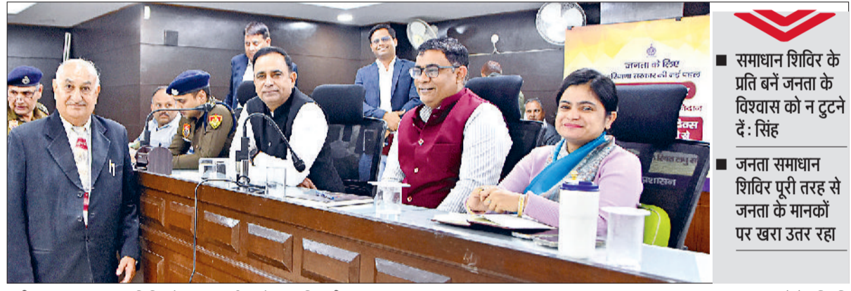
पानीपत। जनता समाधान शिविर में जनसुनवाई करते हुए अधिकारीगण।

उपायुक्त डॉ. वीरेंद्र दहिया ने वीरवार को जिला सचिवालय सभागार में आयोजित जनता समाधान शिविर में जन समस्याओं की सुनवाई करते हुए कहा कि अधिकारियों को निर्देश दिए कि वे समस्याओं के समाधान को लेकर किसी भी प्रकार की जल्दबाजी ना करें। धैर्य व विनम्रता पूर्वक हर समस्या का समाधान करें। उन्होंने कहा कि हमें परिणोमुख बन कर जनता का आशीर्वाद ग्रहण करना है यह सब हमारी ईमानदारी से की गई मेहनत से ही संभव हो पाएगा। उन्होंने कहा कि जनता समाधान शिविर पूरी तरह से जनता के मानकों पर खरा उतर रहा है। जनता द्वारा समस्याओं के समाधान को लेकर किये जा रहे। मूल्यांकन में अच्छी रैंकिंग मिल रही है। समस्याओं को कम से कम समय में