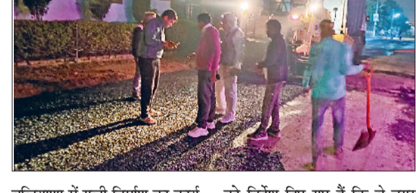
बलियाणा में गली निर्माण का कार्य, सेक्टर 1 व 2 में पार्कों के सौन्दर्यकरण का कार्य प्रगति पर है। इसके अलावा नगर निगम द्वारा निगम क्षेत्र में लगभग 16 करोड़ रुपये से अधिक की लागत से तालाबों के सौन्दर्यकरण का कार्य प्रगति पर है, जिसकी निरंतर रिपोर्ट ली जा रही है। कार्यकारी अभियंता को निदेश दिए गए हैं कि वे नगर निगम क्षेत्र में विकास कार्यों के लिए एक बड़ी परियोजना भी तैयार करें। सभी विकास कार्यों का निरंतर निरीक्षण कर, गुणवत्ता का विशेष ध्यान दिया जाये व कार्यों को निधारित समयावधि में ही पूर्ण करवाया जाये।

नगर निगम आयुक्त धर्मेन्द्र सिंह ने बताया कि विकास कार्यों की निरंतर रिपोर्ट ली जा रही है। उन्होंने कहा कि कार्यकारी अभियंता को निदेश दिए जा चुके हैं कि नगर निगम में विकास कार्यों की निगरानी एवं जिन कार्यों के कार्य आदेश जारी किए जा चुके हैं, उनको तुरंत प्रभाव से चालू करवाया जाए। नगर निगम क्षेत्र में बहुत से कार्य वर्तमान में आरंभ हैं। सेक्टर 1 में सड़क निर्माण का कार्य, तेज कालोनी में लाइब्रेरी हॉल का कार्य, महाबीर कालोनी में गली निर्माण का कार्य चल रहा है। इसके अलावा पालिका बाजार सड़क के साइड का कार्य, फ्रैंड्स कालोनी, गांव बोहर,