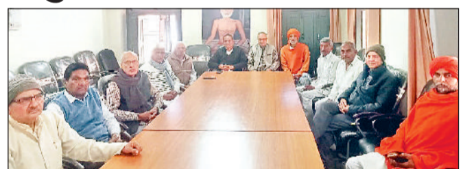
रोहतक। मीटिंग करते आर्य प्रतिनिधि सभा हरयाणा दयानंद मठ के पदाधिकारी।

■ दयानंद मठ में विशेष बैठक आयोजित ■ 9 मार्च को होगा आर्य महासम्मेलन