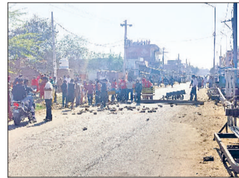
महम। अवैध कब्जा हटाने से गुस्साए लोग।