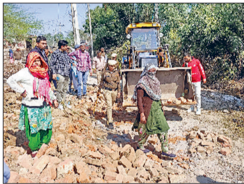
महम। जेसीबी मशीन से अवैध निर्माण हटवाते नपा अधिकारी व पुलिस।