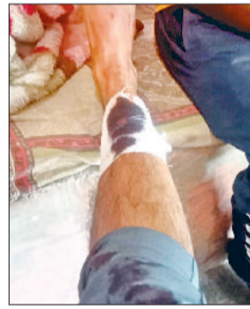
महम। पथरावबाजी में घायल हुआ ठेकेदार का कर्मचारी।

महम थाने में एक लिखित शिकायत दी है। जिसमें कहा गया है कि नगर पालिका की जमीन से अवैध कब्जा हटाने समय कुछ लोगों ने सरकारी कर्मचारी व अधिकारियों पर पथरावबाजी की है तथा गाली गलौच किया है। जिस कारण कब्जा कार्यवाही को बीच में