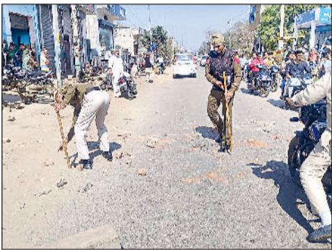
महम। रोड पर पड़े पथरों को हटाने पुलिसकर्मी।

मुख्य बातें ■ नगर पालिका अधिकारियों के कहने पर तारबंदी कर रहे ठेकेदार के कर्मचारी को आई चोटें ■ इयूटी मजिस्ट्रेट ने महम थाने में दी शिकायत, सरकारी काम में बाधा डालने वालों पर होगी कानूनी कार्रवाई