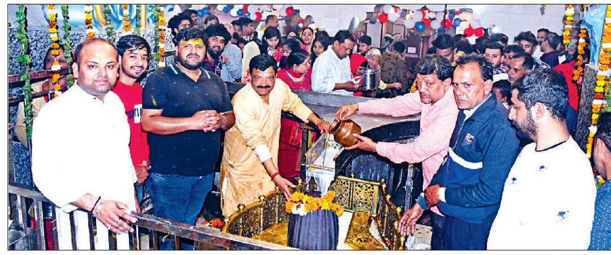
रोहतक। वैश्य कॉलेज रोड स्थित शिव मंदिर में शिवलिंग पर जलाभिषेक करते भक्तजन