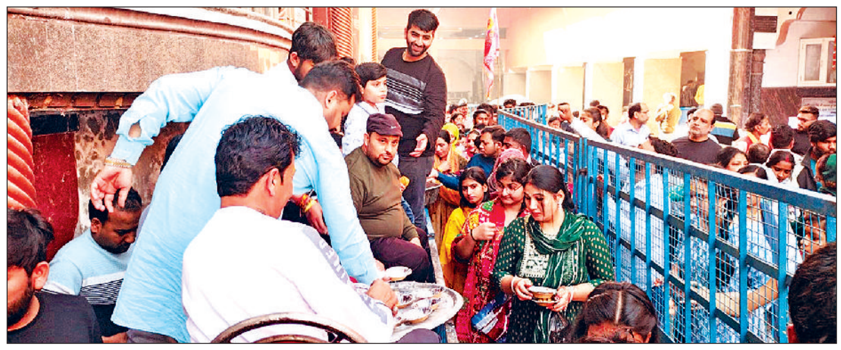
रोहतक। वैश्य कॉलेज रोड स्थित शिव मंदिर में प्रसाद वितरित करते भक्तजन।