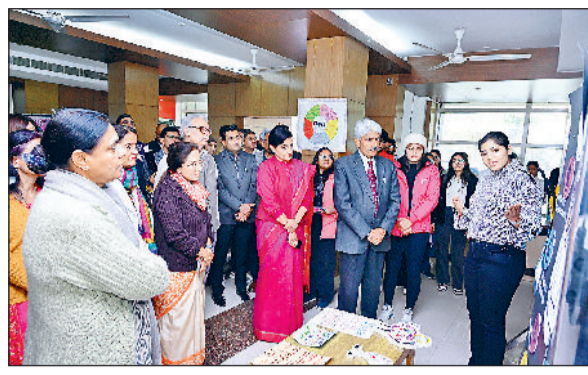
रोहतक। कार्यक्रम में विभिन्न पोस्टरों की जानकारी देती छात्रा और पोस्टर मैकिंग प्रतियोगिता के प्रतिभागियों के साथ अन्य।