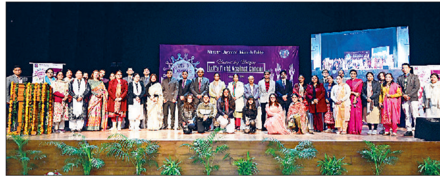
रोहतक। कार्यक्रम में विभिन्न पोस्टरों की जानकारी देती छात्रा और पोस्टर मैकिंग प्रतियोगिता के प्रतिभागियों के साथ अन्य।