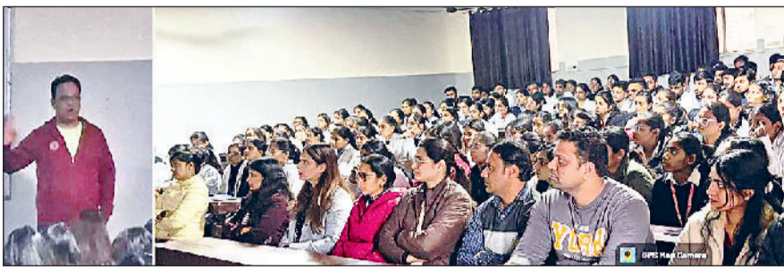
रोहताक। श्रीबाबा मस्तनाथ आयुर्वेदिक कॉलेज में विश्व कैंसर दिवस पर उपस्थित छात्र।