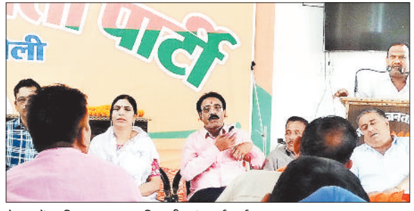
बैठक में शामिल भाजपा पदाधिकारी एवं कार्यकर्ता।

असाक्षरता के अग्रिमार्ग से मुक्त होने की लालक नगर के साथ ग्रामीण क्षेत्रों में भी एक समान देखने को मिली। परीक्षा में पुरुषों के मुकाबले महिलाओं ने बढ़ चढ़ कर हिस्सा लिया। असाक्षरों को परीक्षा केंद्र तक लाने में स्वयंसेवी शिक्षकों की भूमिका सराहनीय रही। परीक्षा के उपरान्त ही उत्तरपुस्तिका का मूल्यांकन शिक्षकों द्वारा किया गया जिसे राज्य साक्षरता मिशन के पोर्टल में ऑनलाइन किया जाएगा।