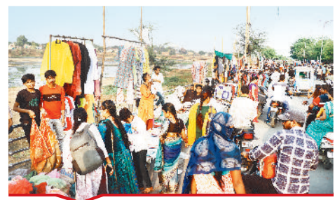
सदर बाजार की जगह रिवरव्यू में संडे मार्केट लगाया गया। जहां लोगों की भीड़ लगी रही।

बिल्हा | मस्तूरी | तखतपुर | मुंगेली | कोटा | लोरमी | सरगांव | पेंड़ा | बेलतारा | रतनपुर | पथरिया