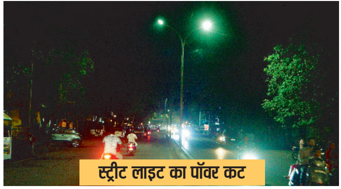
स्ट्रीट लाइट का पावर कट

न्यूनतम तापमान में विशेष परिवर्तन नहीं हो सका है। मौसम के जानकारों के अनुसार दो दिन में एक बार फिर से तापमान बढ़ने की उम्मीद है।