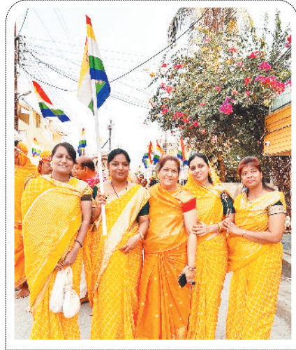
हरिभूमि न्यूज || बिलासपुर

भगवान आदिनाथ की जन्म जयंती के पावन अवसर पर भव्य शोभायात्रा का आयोजन किया गया, जो क्रांति नगर स्थित जैन मंदिर से प्रारंभ होकर शहर के प्रमुख मार्गों से होते हुए वापस मंदिर पहुंची। इस दौरान समाज की श्रावक श्राविका बड़ी संख्या में उपस्थित थे।