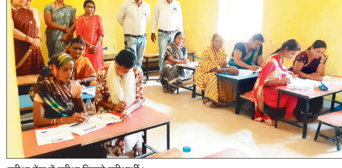
परीक्षा केंद्र में परीक्षा दिलाते परीक्षार्थी।

राज्य साक्षरता मिशन प्राधिकरण की ओर से रविवार को आयोजित उल्लास नवभारत साक्षरता कार्यक्रम बुनियादी परीक्षा विकासखंड के सभी 150 ग्रामों में सफलतापूर्वक संपन्न हुई। क्षेत्र के लगभग सभी प्राथमिक शालाओं को परीक्षा केंद्र बनाया गया और केंद्राध्यक्षों की नियुक्ति कर परीक्षा का विधिवत ढंग से आयोजन किया गया।