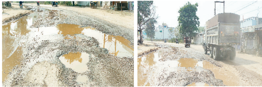
सड़क पर बने गड्डों में भरा पानी। भारी वाहनों के चलने से उड़ रही धूल।