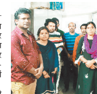
मोपका में प्रार्थना सभा का आयोजन

मोपका में एक समाज के द्वारा प्रार्थना सभा आयोजन करने पर हिन्दू संगठन के लोगों ने मतांतरण करने का आरोप लगाकर जमकर हंगामा मचाया। पुलिस ने अलग-अलग चार मामले दर्ज कर 7 लोगों को गिरफ्तार कर लिया है।