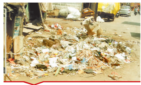
नियमित सफाई न होने से सड़क के किनारे कचरे का ढेर लगा रहता है।

बिल्हा | मस्तूरी | तखतपुर | मुंगेली | कोटा | लोरमी | सरगांव | पेंड़ा | बेलतारा | रतनपुर | पथरिया