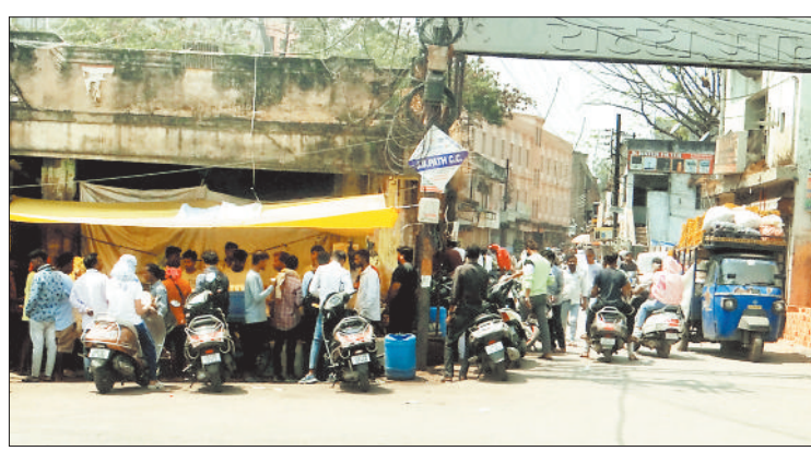
तेलीपारा से मध्यनगरीय की ओर जाने वाली सड़क पर दुकान से लगता है जाम।