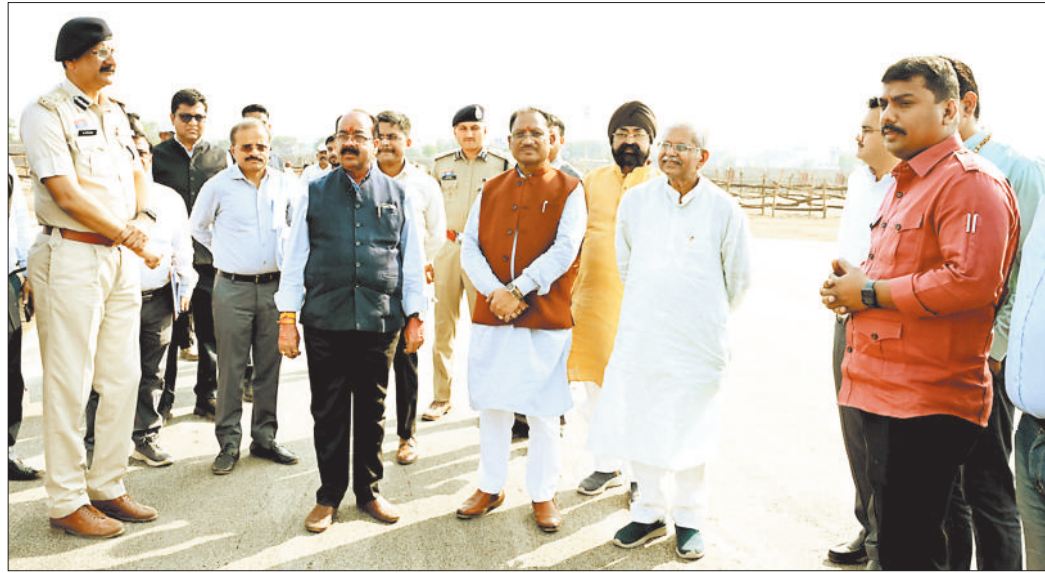
सभा स्थल का निरीक्षण करते हुए मुख्यमंत्री, उपमुख्यमंत्री, विधायक व प्रशासनिक अधिकारी।

मोहभंग में प्रधानमंत्री के आगमन की तैयारी का जायजा लेने पहुंचे मुख्यमंत्री विष्णु देव साय ने बताया कि उपमुख्यमंत्री अरुण साव के नेतृत्व में बिलासपुर में प्रधानमंत्री के 30 मार्च को कार्यक्रम की तैयारी चल रही है। उन्होंने प्रधानमंत्री के आगमन के लिए बने हेलीपैड, मंच व बैठक व्यवस्था का अवलोकन किया। उन्होंने