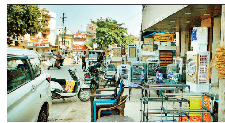
तेलीपारा में दुकान के बाहर फुटपाथ पर व्यापारियों का कब्जा।

हरिभूमि न्यूज ►► बिलासपुर जवाली नाले पर बने करोड़ों रूपए की सड़क आम लोगों के लिए वैकल्पिक सड़क है, हजारों लोग सड़क से होकर अपने काम काज पर जाते हैं, लेकिन सड़क के दोनों ओर बनी दुकान यातायात में बाधा पहुंचा रही है। हालत यह है कि कूलर, कबाड़, दुकानों के सामान और गुमटियां सड़क पर रखे जा रहे हैं, ऐसे में सड़क पर पार्किंग और चलने के लिए जगह नहीं बच पाती है। लोगों को तेज धूप में बेवजह जाम में खड़ा रहने को मजबूर होना पड़ रहा है, लेकिन नगर निगम और यातायात विभाग कार्रवाई करना ही भूल चुका है।