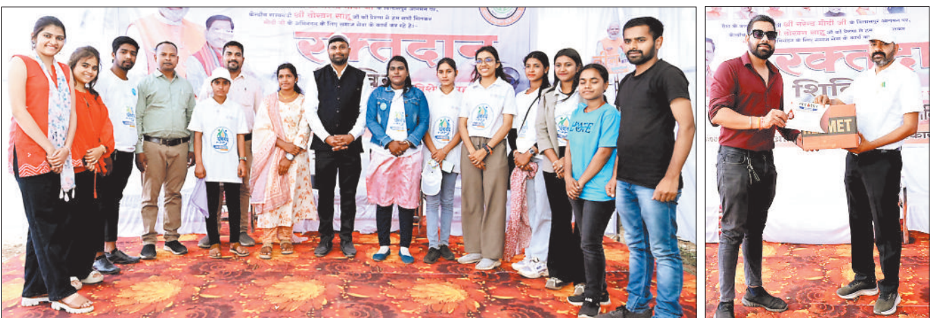
कोनी में जीवन सेवा संस्कार समिति के शिविर में उपस्थित युवा।

हरिमूमि न्यूज ►► बिलासपुर प्रधानमंत्री नरेंद्र मोदी के बिलासपुर आगमन के अवसर पर जीवन सेवा संस्कार समिति द्वारा तीन दिन तीन काम अभियान चलाया जा रहा है। इस सेवा अभियान के माध्यम से समिति के सदस्य प्रधानमंत्री के स्वागत में जय जोहार कह रहे हैं और उनके विचारों को अपने कर्मों के माध्यम से साकार कर रहे हैं। इस अभियान के प्रेरणास्रोत एवं मार्गदर्शक केंद्रीय आवासन एवं शहरी