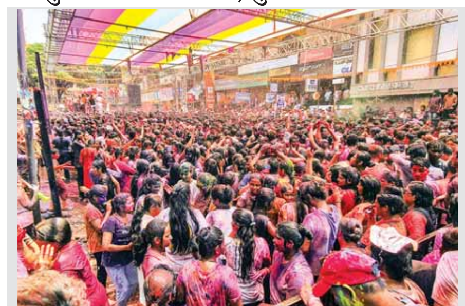
हुबली। हुबली में मंगलवार को लोग रंगों के साथ होली मनाने के लिए एकत्र हुए।