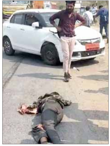
है कि मृतक मंडला का रहने वाला है उनके पास से जो मोबाइल नंबर मिले थे वो फिलहाल नो रिसर्प्स बता रहे है इसलिए विस्तृत विवरण प्रतीक्षित है।