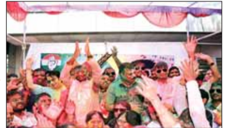
हरिभूमि न्यूज़ | भोपाल