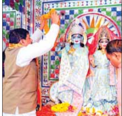
हरिभूमि न्यूज़ | भोपाल