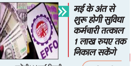
मई के अंत से शुरू होगी सुविधा कर्मचारी तत्काल 1 लाख रुपए तक निकाल सकेंगे