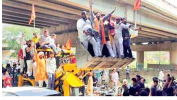
दिल्ली हाईवे कर दिया जाम

सपा सांसद बोले मेरे इस वक्तव्य से कुछ लोगों की भावनाएं आहत हुई हैं, जबकि मेरा ऐसा कोई इरादा नहीं था। मुझे इसका खेद है।