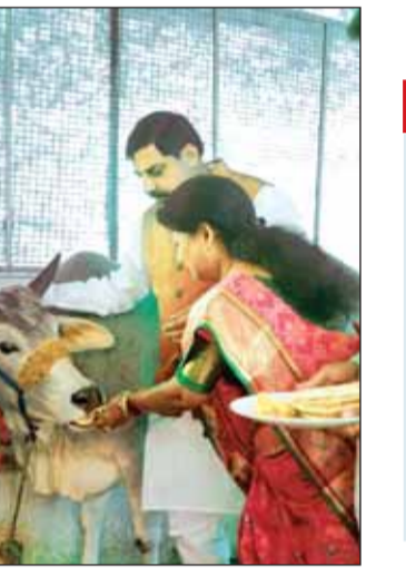
हरिभूमि न्यूज भोपाल