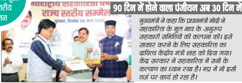
90 दिन में होने वाला पंजीयन अब 30 दिन में

◆ दूध पर बोनस देने के साथ ही अन्य क्षेत्रों की सहकारी संस्थाओं के सदस्यों को करेंगे लाभान्वित