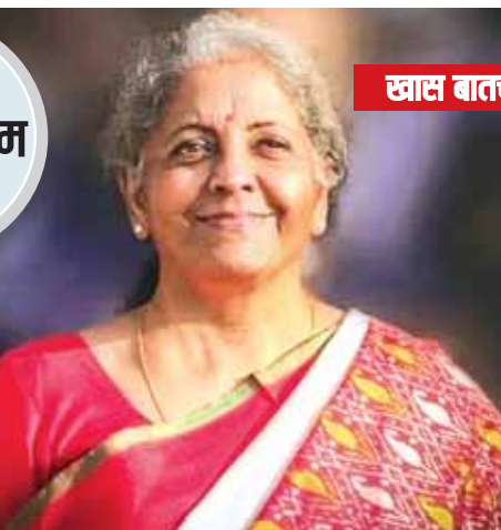
वित्त मंत्री सीतारमण ने संकेत दिए हैं कि जीएसटी सिस्टम में जल्द ही बड़े बदलाव होने वाले हैं। जीएसटी दरों में कमी और टैक्स स्लैब को सरल बनाने की तैयारी अंतिम चरण में है। उन्होंने कहा कि सरकार जीएसटी दरों और स्लैब में कटौती पर जल्द फैसला लेगी। वित्त मंत्री ने यह भी बताया कि वो खुद हर जीएसटी गुप के काम की समीक्षा कर रही हैं ताकि बदलाव देश हित में हों।