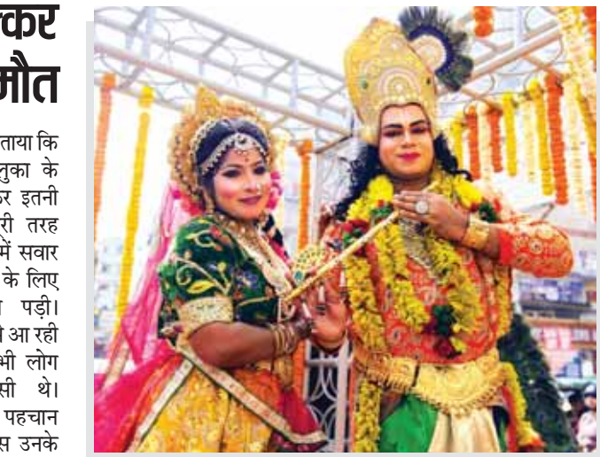
पटना। पटना में रविवार को श्री श्याम फगुन पवित्र ध्वजा निशान शोभा यात्रा में राधा और कृष्ण के रूप में सजे कलाकार भाग लेते हुए।