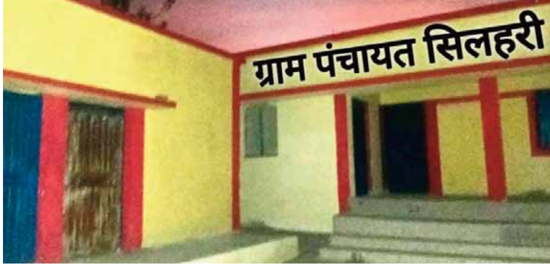
हरिभूमि न्यूज़ डिंडोरी।

सरपंच और प्रभारी सचिव ने धुंधले, बिना प्रयोजन, अमान्य फोटो के जरिए कर दिया लाखों रु. का फर्जी भुगतान जनपद पंचायत डिंडोरी अंतर्गत ग्राम पंचायत सिलहरी का मामला