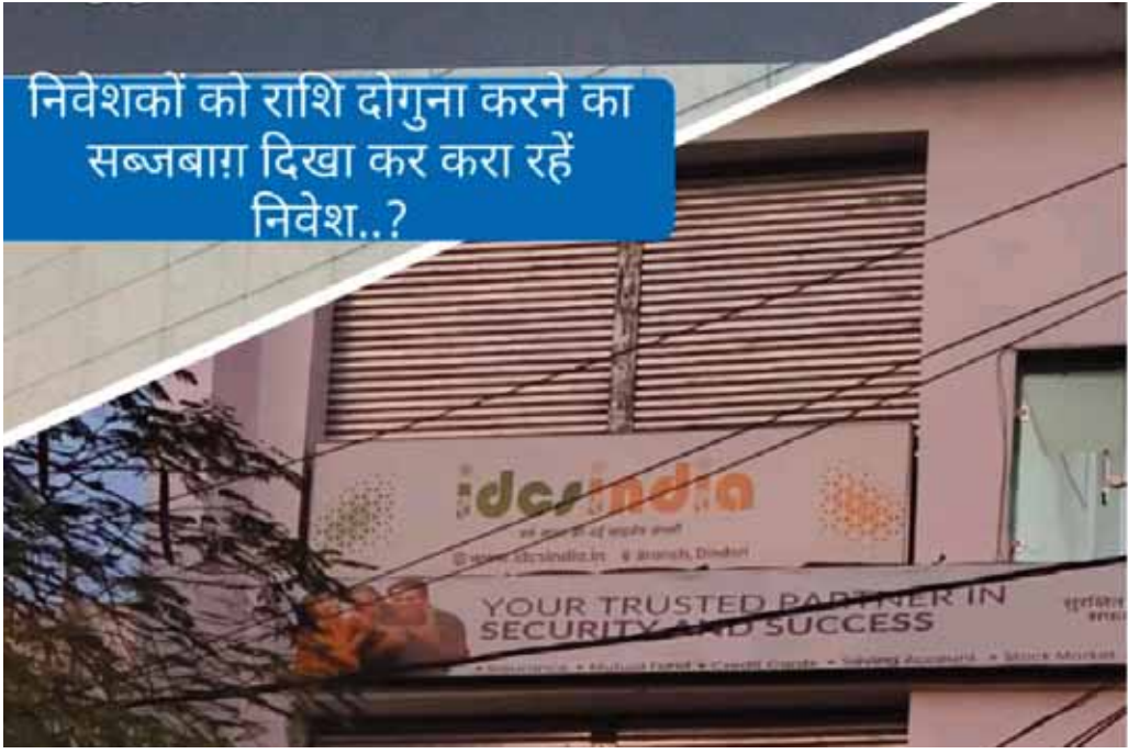
निवेशकों को राशि दोगुना करने का सब्जबाग दिखा कर करा रहें निवेश...?

सेबी में गैर पंजीकृत नियमों के विरुद्ध संचालित हो रहा आईडीसीएस इंडिया चिटफंड कंपनियों की तर्ज पर क्या निवेशकों को लगेगा करोड़ों का फटका डिंडोरी न्यूज़।