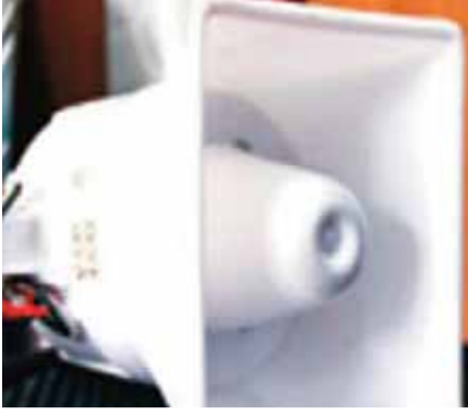
हरिभूमि न्यूज/ गाइरवारा।