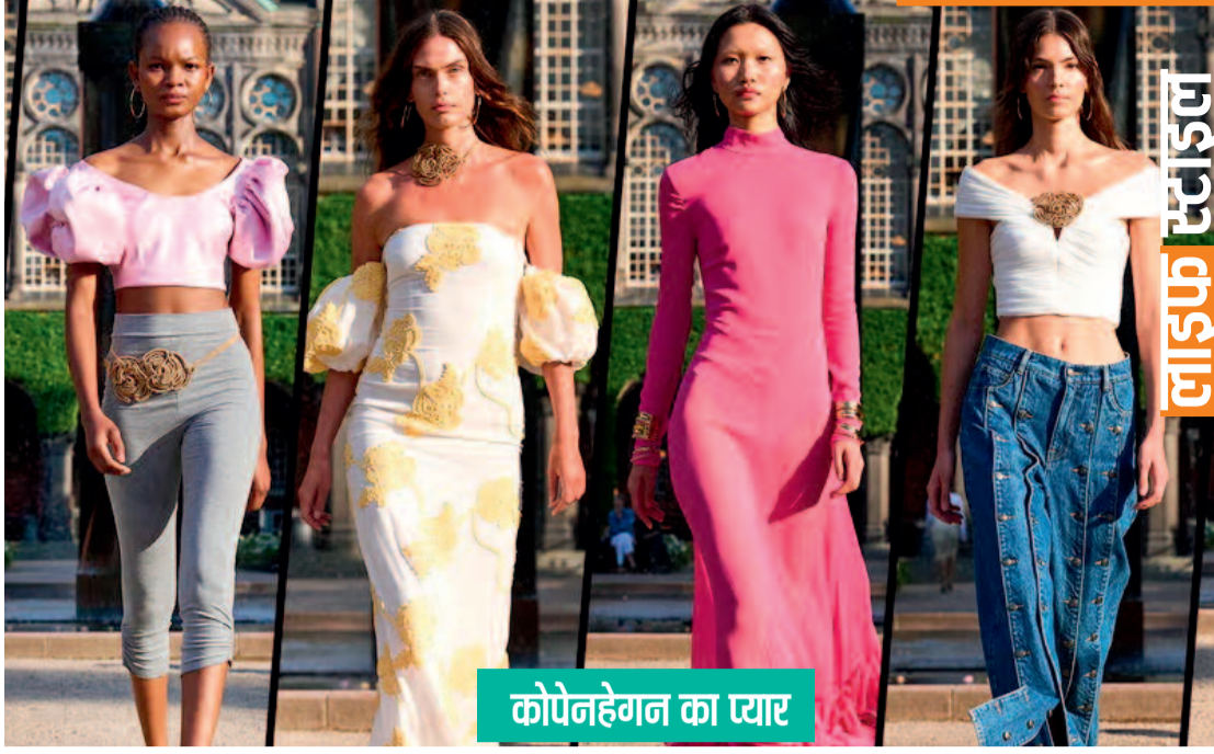
कोपेनहेगन का प्यार