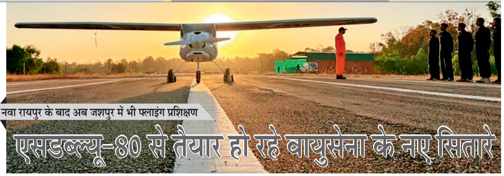
नवा रायपुर के बाद अब जशपुर में भी फ्लाईंग प्रशिक्षण

उम्मीदवार किसी भी पूर्णकालिक रोजगार या शैक्षिक कार्यक्रम में शामिल नहीं होना चाहिए एवं उसके पारिवारिक की आय वित्तीय वर्ष 2024-25 में 8 लाख से कम होनी चाहिए और उसके परिवार का कोई भी सदस्य स्थायी सरकारी पद पर नहीं होना चाहिए। प्रशिक्षु अवधि 12 माह एवं स्टाइपेंड 5 हजार रुपए प्रतिमाह देय होगा एवं 600 रुपए की राशि का वन टाइम ग्रांट प्राप्त होगा। आवेदक अपना पंजीयन इंटरनेट के माध्यम से स्वयं कर सकते हैं या किसी इंटरनेट कैफे, सीएससी, इंस्टीट्यूट के माध्यम से करा सकते हैं। अधिक जानकारी के लिए कार्यालयीन समय में जिला रोजगार एवं स्वरोजगार मार्गदर्शन केंद्र एवं मॉडल कॅरियर सेक्टर कोणडागांव से संपर्क कर सकते हैं।