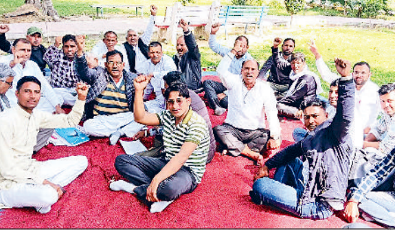
हिसार। यूनियन की बैठक में उपस्थित पदाधिकारी।

23 मार्च को रणबीर गंगवा के आवास का घेराव करेंगे