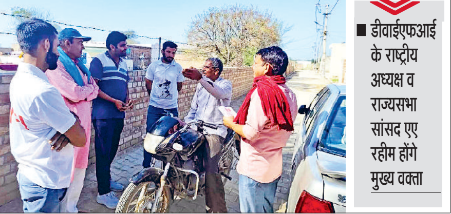
हरिभूमि न्यूज | हिसार

भारत की जनवादी नौजवान सभा का 16वां राज्य स्तरीय युवा सम्मेलन 22 व 23 मार्च को जाट धर्मशाला में होगा। सम्मेलन के पहले दिन खुले अधिवेशन का आयोजन किया जाएगा जिसमें राज्यभर से अनेक प्रतिनिधियों सहित सैकड़ों डीवाईएफआई के युवा कार्यकर्ता व आमजन अपनी हिस्सेदारी करेंगे। खुले अधिवेशन को संबोधित करने के लिए आल