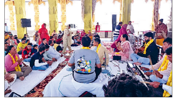
हिसार। श्री तिरुपति बालाजी धाम में आयोजित होली महोत्सव में हिस्सा लेते श्रद्धालु।

तिरुपति धाम में फूलों की होली खेलकर मनाया होली महोत्सव