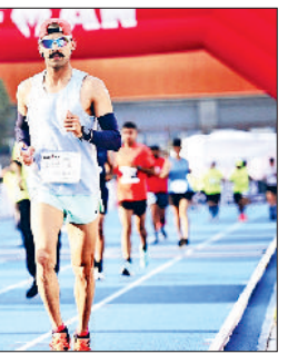
इसमें वे हर दिन 42.2 किमी से अधिक की दूरी तय करेंगे। यह केवल शारीरिक क्षमता की परीक्षा नहीं होगी, बल्कि पूरे देश में फिटनेस और अनुशासन का संदेश फैलाने का एक महाअभियान होगा।