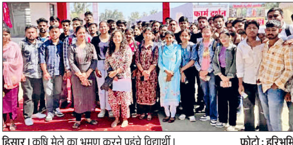
हिसार। कृषि मेले का भ्रमण करने पहुंचे विद्यार्थी।

वैज्ञानिकों द्वारा किए जा रहे शोध कार्यों का लाभ किसानों तक शीघ्र पहुंचे ताकि वे लाभान्वित हो सकें। उन्होंने कहा कि हकृवि द्वारा इजाद की गई नई किस्में अधिक पैदावार देने वाली व गुणवत्तापूर्ण हैं जिसके कारण इनके उन्नत बीजों की हरियाणा सहित अन्य राज्यों में भी मांग है।