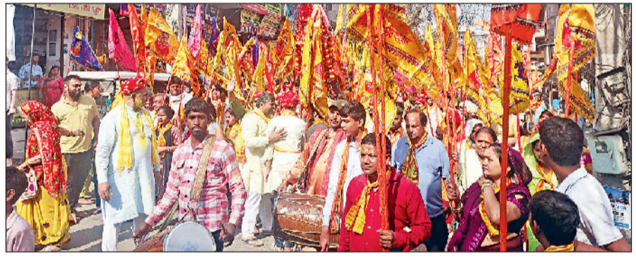
बहादुरगढ़। उत्साह के साथ ध्वजा यात्रा निकालते श्यामभक्त।

फाल्गुन शुक्ल पक्ष एकादशी के दिन बहादुरगढ़ में श्री श्याम ध्वजा निशान यात्रा का भव्य आयोजन हुआ। श्रद्धा और उल्लास से भरपूर यह यात्रा परशुराम मंदिर से शुरू होकर मेन बाजार व नजफगढ़ राड होते हुए श्री बालाजी मंदिर में समाप्त हुई। जहां खाटूश्यामजी को निशान अर्पित किया गया। यात्रा में 1100 निशानों के साथ 2 हजार से अधिक श्याम भक्त शामिल रहे। इसके साथ ही डीजे, पुष्प वर्षा, बैंड बाजा और भजनों का आनंद भी लिया गया।