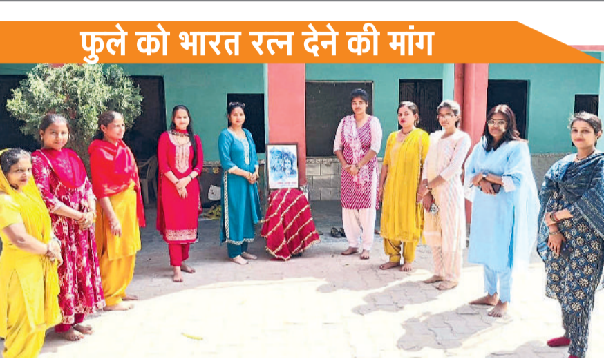
बहादुरगढ़। अकादमी में लौटे विजेता व प्रतिभागी पहलवान।