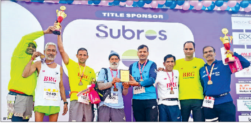
बहादुरगढ़। द्वारका में हुई दौड़ के बाद जीते बीआरजी के धावक।