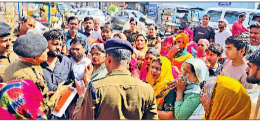
झज्जर। जाम के दौरान महिलाओं से बातचीत करते हुए पुलिस अधिकारी।