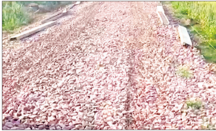
बहादुरगढ़। गांव खरहर में बन रही सीमेंट कंक्रीट की सड़क का बेस।

शासन और प्रशासन द्वारा विकास कार्यों को लेकर बेशक जितने मर्जी दावे किए जा रहे हैं, लेकिन असलियत में ये अधिकांश दावे भ्रष्टाचार की भेंट चढ़ रहे हैं। ताजा मामला गांव खरहर का है। यहां बन रहे सीमेंट कंक्रीट के रोड में मानक के अनुसार सामग्री नहीं लग रही है। ग्रामीणों ने इस घटिया निर्माण कार्य पर नाराजगी जाहिर की है।