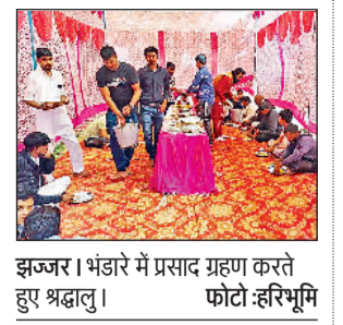
इज्जर। भंडारे में प्रसाद ग्रहण करते हुए श्रद्धालु।