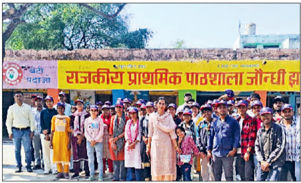
इज्जर। कार्यक्रम के दौरान उपस्थित स्वयंसेवक और स्टॉफ कर्मी।