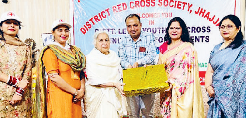
बहादुरगढ़। अतिथियों को स्मृति चिह्न भेंट करती प्रिंसिपल व अन्य।