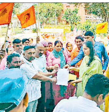
झज्जर। लघुसचिवालय परिसर में प्रदर्शन करते हुए भारतीय मजदूर संघ के सदस्य व प्रदर्शन के बाद नायब तहसीलदार को ज्ञापन सौंपते हुए कर्मचारी।