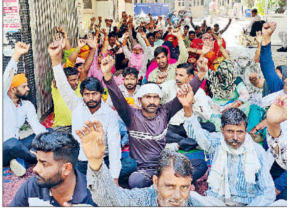
बहादुरगढ़। नारेबाजी करते हड़ताली कर्मचारी।

दरअसल, नगर परिषद के इन कर्मचारियों को समय पर वेतन नहीं मिल रहा। अब भी इनका तीन माह का वेतन बकाया है। इससे पहले ये तीन, चार बार हड़ताल कर चुके हैं। फिर भी समस्या का समाधान नहीं हो पा रहा। इस वजह से इन्होंने एक बार फिर से सोमवार को हड़ताल शुरू कर दी। अनुबंधित सफाई