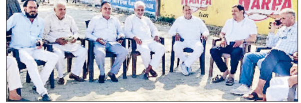
बहादुरगढ़। कार्यकर्ताओं के साथ बजट को लेकर चर्चा करते पूर्व विधायक।