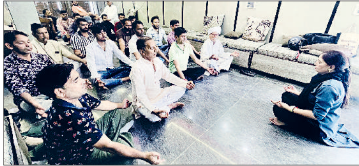
बहादुरगढ़। मंगलवार को सेक्टर-2 में योगाभ्यास करते भाजपाई।

बहादुरगढ़। दिल्ली रोहतक दैनिक रेलयात्री समिति की मांग पर जॉइंट दिल्ली सवारी गाड़ी का संचालन फिर से आरंभ होने पर यात्रियों को राहत मिली है। सवारी गाड़ी नंबर 54034 बहादुरगढ़ रेलवे स्टेशन पर सोमवार शाम के 5 बजकर 55 मिनट की बजाय 7 बजकर 6 मिनट पर पहुंची। दरअसल, यह गाड़ी पिछले 6 माह से अधिक समय से रद्द चल रही थी। दैनिक रेलयात्री समिति द्वारा लिखे पत्र पर संचालन लेते हुए रेल विभाग द्वारा इस गाड़ी का संचालन आरंभ किया गया है। शाम के समय गाड़ी के संचालन से जॉइंट दिल्ली तक यात्रा करने वाले रेल यात्रियों के लिए यह गाड़ी बहुत ही महत्वपूर्ण है। मंगलवार से गाड़ी नंबर 54031 दिल्ली जॉइंट सवारी गाड़ी का संचालन भी आरंभ हो गया। रेल यात्रियों में इस गाड़ी के दोबारा शुरू होने से खुशी की लहर है।