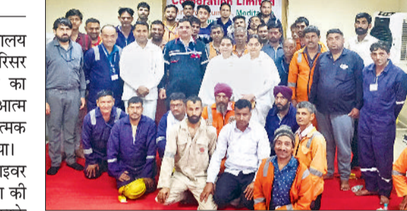
बहादुरगढ़। कार्यक्रम में ब्रह्माकुमारी टीम के साथ प्लांट के कर्मचारी व ट्रक ऑपरटर।

प्रजापिता ब्रह्माकुमारी ईश्वरीय विश्व विद्यालय द्वारा आसौदा स्थित एचपीसीएल प्लांट परिसर में ट्रक चालकों के लिए कार्यशाला का आयोजन किया गया। चालकों को आत्म शक्ति, मानसिक शक्ति और सकारात्मक जीवन शैली के बारे में मार्गदर्शन दिया गया।