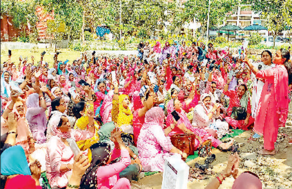
झज्जर। विरोध प्रदर्शन के दौरान सरकार द्वारा मुहैया कराए गए मोबाइल दिखाते हुए आंगनवाड़ी वर्कर्स।

पोषण ट्रेकर अपडेट पर नया काम जोड़ा जा रहा है। अब फेस कैप्चर के माध्यम से राशन देने का जो नया फरमान आया है। इस कार्य को सरकार वर्कर्स से श्री जी के डमी फोन देकर कराना चाहती है। इस फोन में दो सौ एमबी का पोषण ट्रेकर एप ही सही से नहीं खुल रहा। ऑफलाइन काम के लिए वर्कर खुद के रुपये से रजिस्टर खरीद रही हैं। फोन रिचार्ज के नाम पर नाममात्र रुपये दिए जा रहे हैं। अगर सरकार को इस तरह के आफिशियल कार्य करवाने हैं तो उसके लिए अच्छे फोन सिम समेत दें और सही से