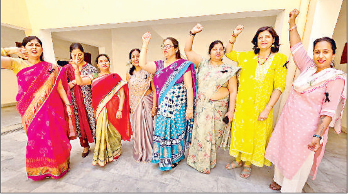
इज्जर। काले बिल्ले लगाकर सांकेतिक विरोध जताते हुए महाविद्यालय की शिक्षिकाएं।

मुख्य मांगों में ओल्ड पेंशन स्कीम, एमफिल तथा पीएचडी के एडवांस इंकीमेंट से संबंधित मामला एसोसिएट तथा प्रोफेसर के प्रमोशन में पीएचडी की अनिवार्यता को हटाना तथा यूनिवर्सिटी ग्रांट कमीशन के रेगुलेशन 2025 और राष्ट्रीय शिक्षा नीति 2020 को वापस लेना शामिल है।