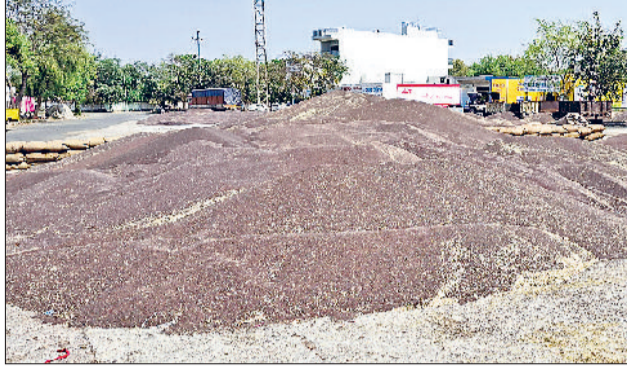
झज्जर। अनाज मंडी परिसर में लगी सरसों की ढेरियां।