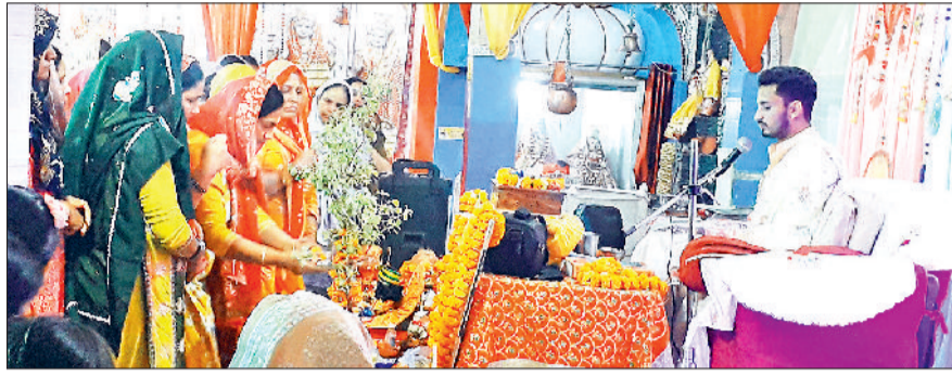
झज्जर। कथा के दौरान भगवान श्रीकृष्ण की आरती करते हुए श्रद्धालु।