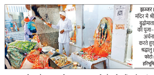
इज्जर। मंदिर में श्री बुद्धोमाता की पूजा-अर्चना करते हुए श्रद्धालु।

बुधवार को शहर के माता गेट क्षेत्र में स्थित बुद्धो माता मंदिर में श्रद्धालुओं ने पूजा अर्चना की। महिलाएं पारंपरिक वेषभूषा में अपने बच्चों के साथ मंदिर पहुंचीं तथा बुद्धोमाता की पूजा करते हुए अपनी संतान की दीर्घायु व परिवार के मंगल की कामना की। श्रद्धालुओं ने मंगलवार की रात्रि बनाए गए गुड के चावल का प्रसाद बुद्धोमाता के चरणों में अर्पित किया। इसके बाद उन्होंने चौगान माता, बाबा प्रसादगिरी मंदिर के अलावा जगह-जगह पर बनाए गए पूजा स्थलों पर भी प्रसाद चढ़ाया। हालांकि बीते