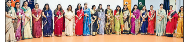
बहादुरगढ़। कार्यक्रम में मौजूद शिक्षक।