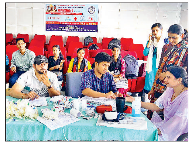
झज्जर। शिविर के दौरान उपस्थित विकित्सीय टीम एवं अन्य।