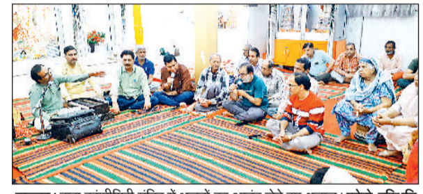
झज्जर। बाबा कांशीगिरी मंदिर में भजनों का आनंद लेते हुए श्रद्धालु।