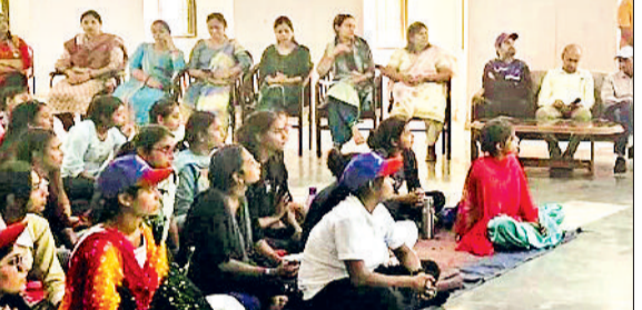
बहादुरगढ़। कार्यक्रम में मौजूद विद्यार्थी।