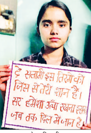
बहादुरगढ़। स्लोगन दिखाती एक छात्रा।