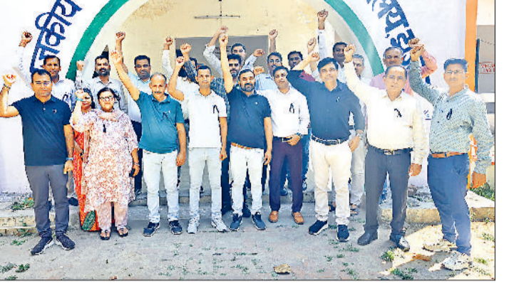
इज्जर। राजकीय नेहरू महाविद्यालय में प्रदर्शन करते हुए शिक्षक।