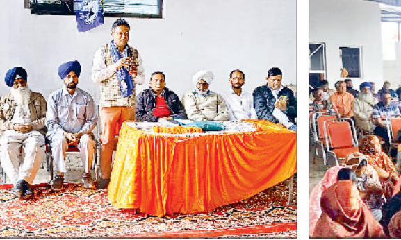
अंबाला। बसपा कार्यकर्ताओं को संबोधित करते हुए पार्टी पदाधिकारी।