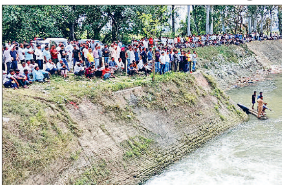
इंद्रि। गांव धनोरा जागीर के पास पश्चिमी यमुना नहर में गिरे युवकों को ढूंढते गोताखोर तथा पास खड़े ग्रामीण।