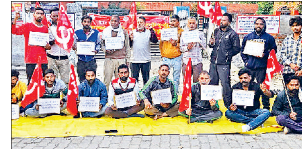
नारायणगढ़। प्रदर्शन करते हुए सफाई कर्मचारी।