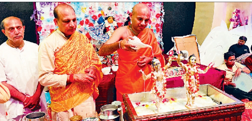
पानीपत। भगवान श्री कृष्ण का पूजन करते हुए संगणन व एलिटको में होली पर्व खेलते नागरिक।