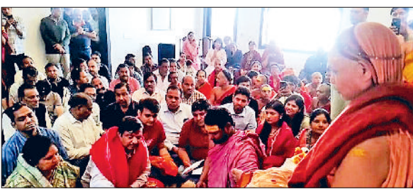
तरावड़ी। स्वामी शंकराचार्य अविमुक्तेश्वरानंद का स्वागत करते हुये

सनातन धर्म की रक्षा करने के लिए हर हिंदू का धर्म है। सबसे पहले हमने सनातन धर्म को समझना होगा धर्म कह रक्षा करते करते अधर्म की रक्षा हो जाती है। हिंदुओं को अपने धर्म की रक्षा करने के लिए आगे आना होगा। गोयल इंटरनेशनल प्राइवेट लिमिटेड में पहुंचे शंकराचार्य अविमुक्तेश्वरानंद ने