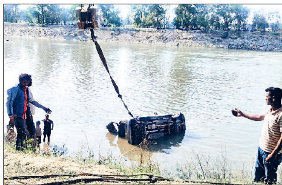
इंद्रि। गांव धनोरा जागीर के पास पश्चिमी यमुना नहर में गिरे युवकों को ढूंढते गोताखोर तथा पास खड़े ग्रामीण।

शवों को करनाल पोस्टमार्टम के लिए भेज कर घटना की जांच शुरू कर दी है। इस मामले में इंद्रि थाना