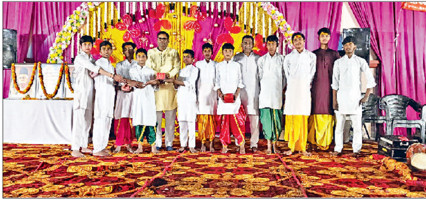
करनाल। राजकीय कन्या वरिष्ठ माध्यमिक विद्यालय में हर्षोल्लास के साथ होली मिलन समारोह मनाते हुए।

उन्होंने कहा कि राष्ट्रीय स्वयंसेवक संघ समाज को जोड़ने का कार्य करता है। यह केवल एक दिवस मनाने वाला त्योहार नहीं, बल्कि