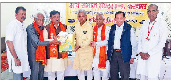
करनाल। वैदिक होली कार्यक्रम में गणमान्य लोगों को सम्मानित करते हुए।