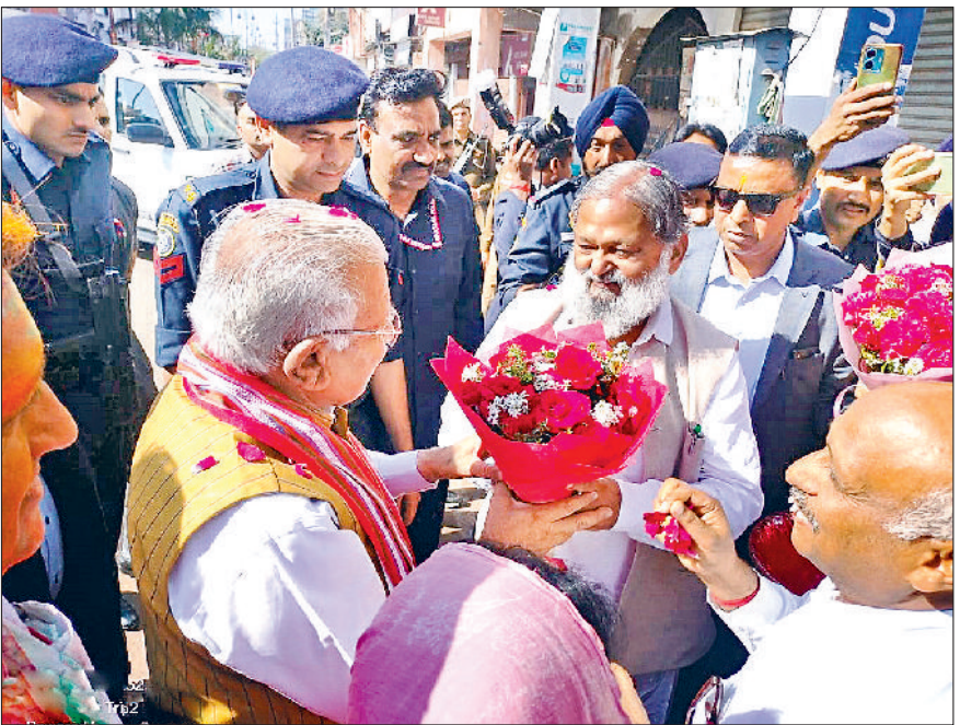
अंबाला। केंद्रीय मंत्री मनोहर लाल का अभिन्दन करते हुए मंत्री विज व अन्य।

होली के अवसर पर केंद्रीय मंत्री मनोहर लाल ने अंबाला छावनी में पहुंच मंत्री अनिल विज, निर्वाचित नया अध्यक्ष व सदस्यों के साथ होली मनाई। इससे पहले यहां पहुंचने पर उनका भव्य स्वागत किया गया। इस दौरान विज ने केंद्रीय मंत्री के समक्ष अंबाला से चंडीगढ़ तक मेट्रो ट्रेन चलाने की मांग रखी। उन्होंने कहा कि चंडीगढ़ हमारी राजधानी है। मगर चंडीगढ़ तक पहुंचना बहुत मुश्किल होता है। चंडीगढ़ जाने वाली सड़क पूरी तरह जाम रहती है। लोगों के चंडीगढ़ आने-जाने में कई घंटे लगते हैं। हालांकि इससे पहले केंद्रीय मंत्री मनोहरलाल ने मंत्री अनिल विज, नगर परिषद में नवनिर्वाचित भाजपा नया अध्यक्ष व 25 सदस्यों और भाजपा नेताओं के साथ फूलों से होली खेलकर शुभकामनाएं दीं। इस दौरान विज ने