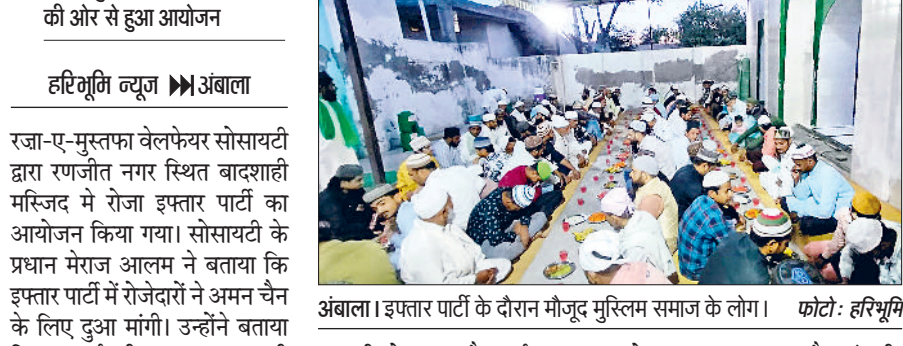
अंबाला। इफ्तार पार्टी के दौरान मौजूद मुस्लिम समाज के लोग।