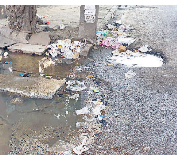
रोहतक। सिल्लि रोड स्थित अप्पू घर के पास रोजाना पानी भरा रहता है जिससे आने जाने वाले व दुकानदार दिक्कत होती है। इस सड़क से प्रतिदिन हजारों लोग गुजरते हैं। लेकिन कोई ध्यान नहीं देता है।