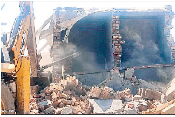
कॉलोनी में इंटरलॉक रोड नेटवर्क, कच्चा रोड नेटवर्क, 6 नींव, एक चारदीवारी व एक निर्माण को तोड़ा