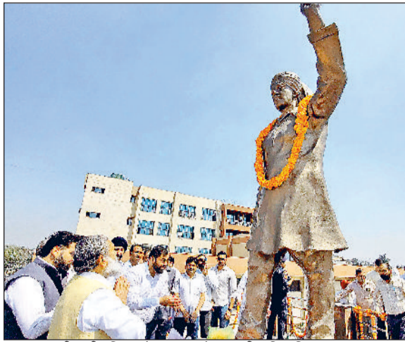
अंबाला। शहीद की प्रतिमा को नमन करते हुए मंत्री अनिल विज।

ऊर्जा, परिवहन एवं श्रम मंत्री अनिल विज ने कहा कि उनके जेहन में एक बात हमेशा गूंजती है कि आजादी के आंदोलन में महात्मा गांधी उस समय देश की रहनुमाई कर रहे थे और उन्होंने कई भूख हड़ताल की, लेकिन यदि वे भगत सिंह के लिए एक भी भूख हड़ताल करते तो आजाद हिंदुस्तान की रोशनी शहीद-ए-आजम भगत सिंह