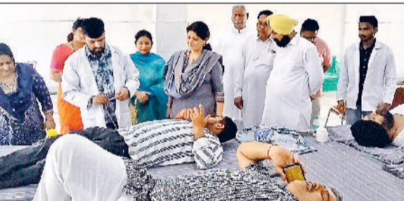
कैप में रक्तदान करते हुए रक्तदाता।