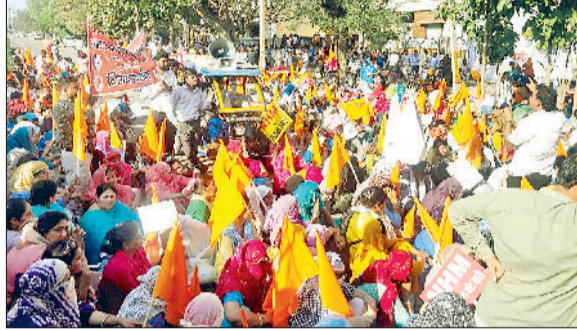
कुरुक्षेत्र। धरना देते एनएचएम कर्मचारी।

कुरुक्षेत्र में मुख्यमंत्री आवास का घेराव करने जा रहे एनएचएम कर्मचारियों पर पुलिस ने वाटर कैनन और आंसू गैस का प्रयोग किया। मुख्यमंत्री आवास का घेराव करने के लिए सुबह से ही स्वास्थ्य कर्मचारी संघ हरियाणा सम्बंधित भारतीय मजदूर संघ के नेतृत्व में प्रदेश भर के एनएचएम कर्मचारी पिपली में देवीलाल पार्क में जुटना शुरू हो गए थे। इनमें भारी