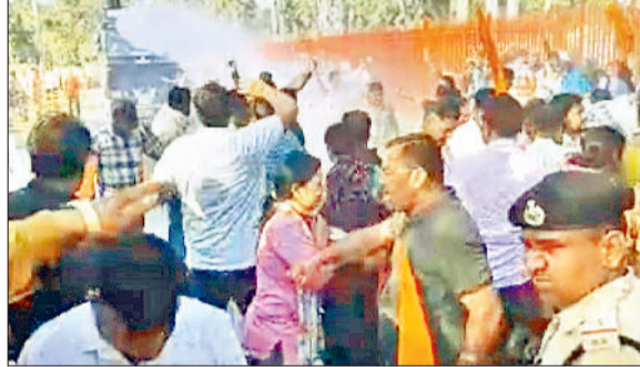
कुरुक्षेत्र। कर्मचारियों पर वाटर कैनन का प्रयोग करते पुलिस कर्मी।

संख्या में महिला कर्मचारी भी मौजूद रहे। प्रदेश भर के एनएचएम कर्मचारियों के जुटने पर पुलिस प्रशासन भी मुस्दत रहा। पुलिस ने कर्मचारियों को रोकने के लिए दो जगह पर बैरिकेटिंग की। मोकै पर वज्र वाहन, वाटर कैनन वाहन सहित भारी पुलिस बल मौजूद रहा। दोपहर 3 बजे सभी एनएचएम कर्मचारी देवीलाल पार्क से मुख्यमंत्री आवास की ओर रोप प्रदर्शन करते हुए रवाना हुए। पुलिस ने एनएचएम कर्मचारियों को ज़िंदा लौटने के लिए बैरिकेट लगाकर रोक दिया। कर्मचारियों ने वही पर धरना शुरू कर दिया। कर्मचारी नेताओं ने कहा कि वे अपनी मांगों को लेकर मुख्यमंत्री से मिलने जा रहे थे लेकिन पुलिस ने उन्हें रास्ते में ही