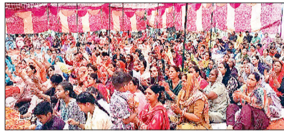
बराड़ा। गोशाला में आयोजित कार्यक्रम में कथा श्रवण करते श्रद्धालु।