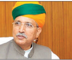
जानकारी कानून मंत्री अर्जुन राम मेघवाला ने फरवरी महीने में राज्यसभा में दी थी। कानून मंत्रालय के अनुसार अस्पष्ट आदेश लोगों को परेशान करते हैं। इससे या तो लाभार्थियों को लाभ नहीं मिलता। इसके साथ ही कानूनी प्रक्रिया को सरल बनाया जाएगा।

कानून मंत्रालय ने कहा है कि जनहित में लिए गए फैसलों को अगर ठीक से लागू नहीं किया जाए, तो इससे लोगों को अदालत का दरवाजा खटखटाना पड़ सकता है। इससे केंद्र सरकार पर कानूनी बोझ बढ़ता है। मंत्रालय ने सरकार से जुड़े मुकदमों की संख्या को कम करने के लिए खास कदम उठाए हैं। अदालतों में करीब सात लाख मामलों में केंद्र सरकार एक पक्ष है। अकेले वित्त मंत्रालय ही लगभग 1.9 लाख मामलों में पक्षकार है। ये