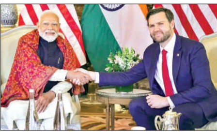
सोमवार शाम 6:30 बजे पीएम मोदी वेंस की नेगोवानी करेंगे, जिसमें प्रस्तावित भारत-अमेरिकी द्विपक्षीय व्यापार समझौते को जल्द अंतिम रूप देने के साथ-साथ दोनों देशों के बीच संबंधों को और बेहतर बनाने के तरीकों पर चर्चा होगी। पीएम मोदी के नेतृत्व में भारतीय दल में विदेश मंत्री एस. जयशंकर, राष्ट्रीय सुरक्षा सलाहकार (एनएसए) अजीत डोभाल, विदेश सचिव विक्रम मिश्रा और अमेरिका में भारतीय राजदूत विनय मोहन क्वारा के शामिल होने की उम्मीद है।