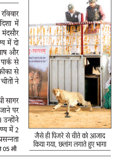
जैसे ही पिंजरे से चीते को आजाद किया गया, छलांग लगाते हुए भागा

मुख्यमंत्री डॉ. मोहन यादव ने रविवार को वन्य जीव संरक्षण की दिशा में ऐतिहासिक कदम उठाते हुए मंदसौर जिले के गांधी सागर अभयारण्य में दो चीते छोड़े। चीतों के नाम प्रभाष और पावक हैं। इन्हें कुनो नेशनल पार्क से यहां लाया गया है। दक्षिण अफ्रीका से फरवरी 2023 में लाए गए इन चीतों ने कुनो में दो साल बिताए हैं। डॉ. यादव ने प्रदेश के गांधी सागर अभयारण्य में चीतों के छोड़े जाने पर प्रदेशवासियों को बधाई दी है। उन्होंने कहा कि गांधी सागर अभयारण्य में 2 चीते छोड़े जाने का अवसर प्रसन्नता शेष पेज 6 पर पढ़ें पेज 05 भी