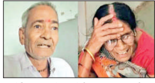
पीड़ित अपनी पत्नी के साथ इलाज के लिए करीब 30 किमी का सफर तय करके जिला अस्पताल आए थे, लेकिन बिना इलाज ही जाना पड़ा।