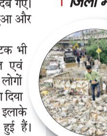
जम्मू एयरपोर्ट की भी कई फ्लाइट्स रद्द की गईं

रामबन, उधमपुर, पुंछ और बारामुला जिलों में अलर्ट