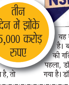
तीन दिन में झोंके 15,000 करोड़ रुपए

अमेरिका से दूर भारत जैसे उभरते बाजारों की ओर धकेल रही है। दूसरा, अमेरिका और चीन दोनों की विकास दर इस साल कम रहने की संभावना है। वहीं, भारत की जीडीपी विकास दर वित्त वर्ष 2026 में 6 फीसदी रहने की उम्मीद है। यह बेहतर प्रदर्शन भारत को वैश्विक पूंजी के लिए एक आकर्षक जगह बना सकता है। निवेशकों का ध्यान घरेलू खपत से जुड़े क्षेत्रों जैसे फाइनेंस, टेलीकॉम, एविएशन, सीमेंट, कुछ ऑटो कंपनियों और हेल्थकेयर स्टॉक्स पर रहने की संभावना है। विशेजों के अनुसार अगर डॉलर इंडेक्स गिरता रहता है, तो उभरते बाजारों के लिए एफआइआई की पसंद बेहतर होगी। उभरते बाजारों में, भारत का दृष्टिकोण अपेक्षाकृत मजबूत और आकर्षक बना हुआ है। हालांकि, उन्होंने यह भी कहा कि अभी भी अनिश्चितताएं बहुत ज्यादा हैं। इस बीच भारतीय रुपया भी मजबूत हो रहा है। शुक्रवार को यह लगातार चौथे दिन मजबूत हुआ और 31 पैसे बढ़कर 85.37 पर बंद हुआ। यह 4 अप्रैल के बाद सबसे मजबूत क्लोजिंग है। इस तेजी को इक्विटी में निवेश और बाजार में सकारात्मक माहौल से समर्थन मिला।