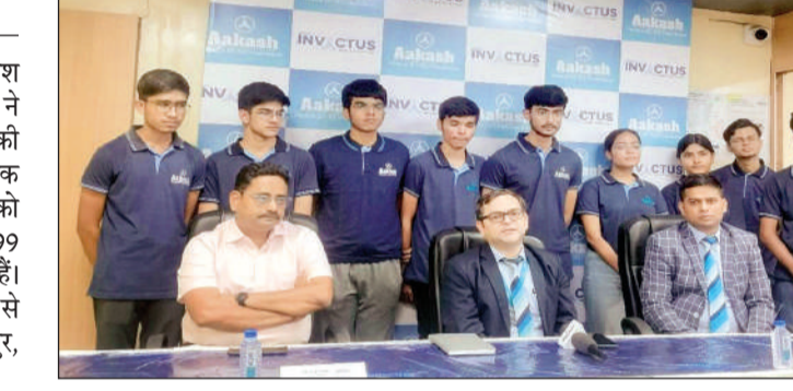
चुनौतीपूर्ण परीक्षाओं में से एक में सफलता हासिल कर रहे हैं। नेशनल टैरिफ एजेंसी ने आज परिणाम घोषित किए, जिससे इस वर्ष के लिए निर्धारित जेईई के दूसरे और अंतिम सेशन का समापन हुआ। इनमें से अधिकांश छात्र आकाश के क्लासरूम प्रोग्राम से जुड़े हुए थे, जिनका लक्ष्य प्रतिष्ठित आईआईटी-जेईई को रैंक करना था, जिसे विश्व स्तर पर सबसे कठिन प्रवेश परीक्षाओं में से एक माना जाता है। जेईई (मेन) को दो सेशन में आयोजित किया जाता है ताकि छात्रों को अपने स्कोर सुधारने के कई अवसर मिल सकें। जहां जेईई एडवॉन्स केवल प्रतिष्ठित भारतीय प्रौद्योगिकी संस्थानों (आईआईटी) में प्रवेश के लिए होता है, वहीं जेईई मेन देशभर के कई नेशनल इंस्टीट्यूट ऑफ टेक्नोलॉजी (एनआईटी) और अन्य केंद्रीय सहायता प्राप्त इंजीनियरिंग कॉलेजों में प्रवेश का मार्ग प्रशस्त करता है। जेईई एडवॉन्स में शामिल होने के लिए जेईई मेन में भाग लेना अनिवार्य है। एईएसएल को मॉडकल (एनईईटी), इंजीनियरिंग (जेईई), एनटीएसई और ऑलंपियाड्स जैसी उच्च-स्तरीय परीक्षाओं के लिए प्रभावी और व्यापक तैयारी कार्यक्रम प्रदान करने के लिए जाना जाता है। संस्थान छात्रों को उनकी पूरी क्षमता का एहसास दिलाने और उनकी अकादमिक सफलता में सहायता करने के लिए समर्पित है।