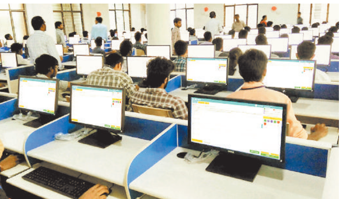
शहर स्थित विभिन्न कोचिंग संस्थाओं द्वारा परीक्षा की तैयारी करवाई जा रही है। जिसमें शॉर्ट नोट्स, कठिन प्रश्नों को लंबे समय तक याद रखने की टेक्निक और क्लास टेस्ट से

बोर्ड एग्जाम खत्म होते ही छात्र जेईई, नीट, एनडीए की तैयारी में जुट गए हैं, स्टूडेंट कोचिंग और पर्सनल नोट्स की मदद से एग्जाम की तैयारी कर रहे हैं। नेशनल टेस्ट एजेंसी तीन बड़ी परीक्षा लेने जा रहा है, जिसमें जेईई मेंस व एडवांस और नीट मेडिकल की परीक्षा को एनटीए द्वारा आयोजित की जाएगी। जेईई मेंस की परीक्षा बुधवार से शुरू होने जा रही है, यह परीक्षा 8 अप्रैल तक चलेंगी जिसका रिजल्ट 17 अप्रैल का आएगा।