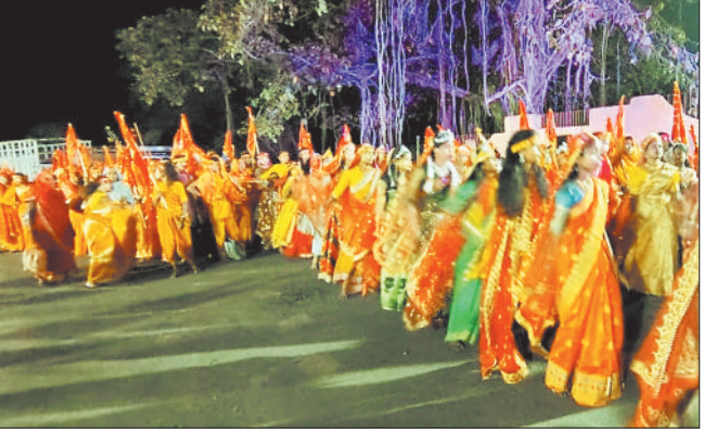
मंदिर प्रांगण में लगी श्रद्धालुओं की कतार।

श्रद्धालुओं ने बोए जवारे, जलवाए पेंड़ा रोड रेलवे स्टेशन से 22 किमी दूरी पर स्थित है धनपुर पदयात्रा कर मंदिर तक माता के दर्शन को पहुंचते हैं हजारों श्रद्धालु