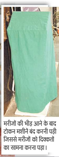
मरीजों की भीड़ आने के बाद टोकन मशीनें बंद करनी पड़ी जिससे मरीजों को दिक्कतों का सामना करना पड़ा।

बिलासपुर। सिक्स में दो दिन की छुट्टी के बाद मंगलवार को ओपीडी खोली गई, जहां डाक्टरों ने मरीजों का इलाज भी किया, लेकिन इस दौरान सिक्स में व्यवस्थाओं की पोल खुलती रही। खास बात यह है 1800 से अधिक मरीजों की भीड़ आने के बाद ओपीडी और पैथोलेब के लिए काटी जाने वाली टोकन मशीनें बंद करनी पड़ी, जिससे मरीजों के साथ ही कर्मचारियों को भी खासी दिक्कतों का सामना करना पड़ा। कई लोगों को ओपीडी के दौरान लेब की रिपोर्ट तक नहीं मिल सकी।