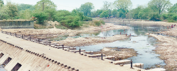
पानी नहीं होने से सूख गया है मनियारी एनीकट।

हरिभूमि न्यूज ▶▶ तखतपुर मनियारी एनीकट में पानी नहीं आने के कारण नगर में निस्तारी की समस्या तो उत्पन्न हो गई है इसके बाद ही जल स्तर कम होने के कारण नगर के नलकूप के कंठ भी सूखते जा रहे हैं। पानी रसातल में पहुंच गया है एवं नगरवासीयों को निस्तारी की भारी समस्या हो रही है। नगर की जीवन दायिनी नदी पिछले एक माह से सूखी हुई है, मनियारी नदी में पानी नहीं होने के कारण आम लोगों में निस्तारी की समस्या तो खड़ी हुई ही है साथ में नदी सूख जाने के कारण मवेशियों को पानी पीने की भारी समस्या हो रही है। साथ ही नदी में स्नान एवं नित्य कर्म करने वाले लोगों को भी नदी में पानी सूख जाने के कारण परेशानी हो रही है।