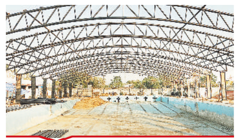
जिला खेल परिसर में बनाया जा रहा है अत्याधुनिक स्वीमिंग पूल।

[बिल्हा | मस्तूरी | तखतपुर | मुंगेली | कोटा | लोरमी | सरगांव | पेड़ा | बेलतारा | रतनपुर | पथरिया]