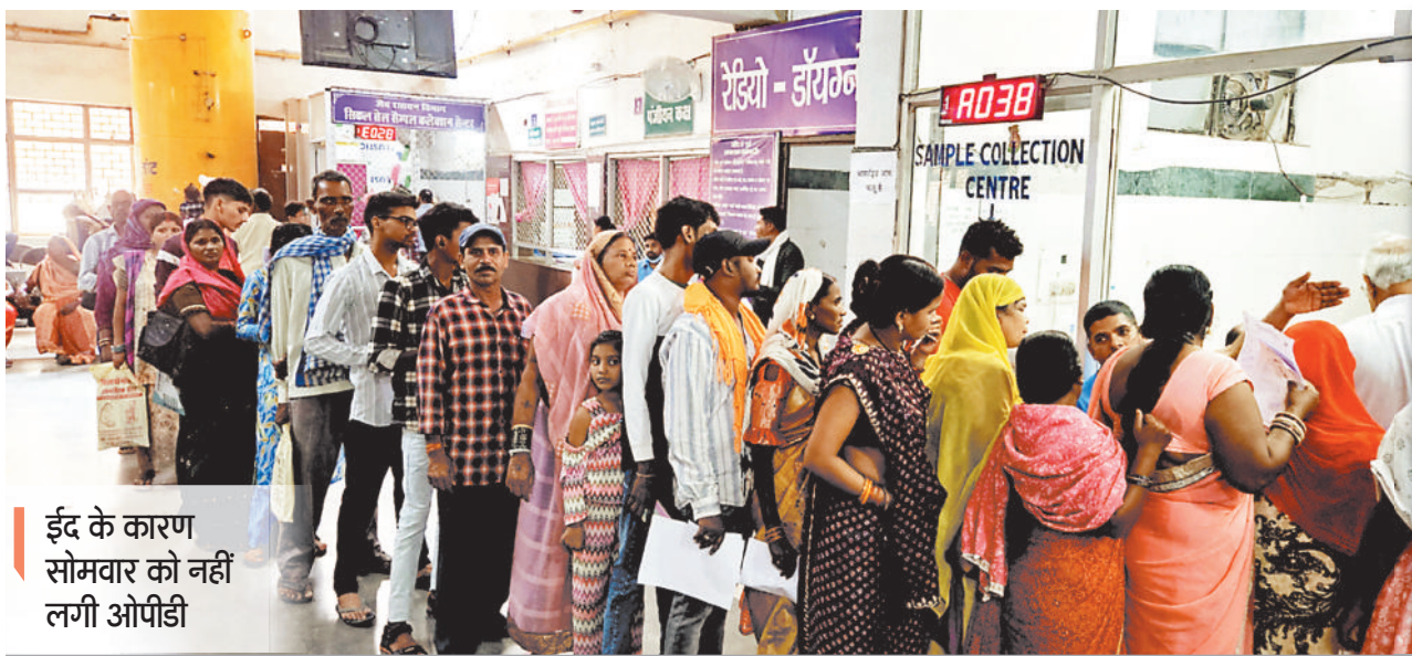
ईद के कारण सोमवार को नहीं लगी ओपीडी