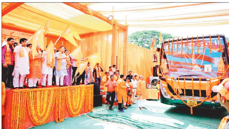
बस को हरी झण्डी दिखाकर रवाना करते जनप्रतिनिधि।