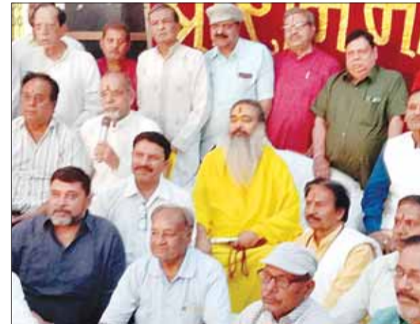
श्रीराम मंदिर मदन महल, श्रीकृष्ण मंदिर गोरखपुर, श्री गोविन्दगंज रामलीला समिति मिलेनीगंज, श्री सनातन कृष्ण मंदिर छोटी ओमती, झुलैलाल मंदिर, जयश्री कृष्ण समा बाई का बगीचा, गोपाल मंदिर