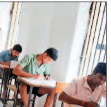
12वीं की ओपनबोर्ड परीक्षा में 10 बंदी एवं 10 वीं की परीक्षा में 12 बंदी कुल 22 बंदी परीक्षा में सम्मिलित हो रहे हैं। ज्ञात हो कि 2020 एवं 2021 के प्रस्ताव को छत्तीसगढ़ राज्य ओपन स्कूल रायपुर ने स्वीकृत करते हुए जिला जेल कांकेर को नवीन परीक्षा केंद्र 0817 घोषित कर आदेशित किया गया था, अब प्रतिवर्ष जेल बंदियों को सुरक्षा की दृष्टि से वर्ष में तीन बार अप्रैल,

हरिभूमि न्यूज ►► कांकेर जिला जेल में कैद विचाराधीन, नक्सली प्रकरण व सजायापता बंदियों को समाज की मुख्यधारा में जोड़ने के उद्देश्य से छत्तीसगढ़ राज्य ओपन स्कूल के द्वारा 10 वीं एवं 12 वीं के लिए जिला जेल में परीक्षा केंद्र प्रारंभ होने का प्रयास रंग लाया है। जेल में बंद कैदी पढ़ाई करके परीक्षा दे रहे हैं और यह परीक्षाएं भी पास कर रहे हैं।