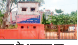
छात्रा के अपहरण का मामला आया सामने जांच में जुटी पुलिस

कांकेर। थाना कांकेर क्षेत्र से नाबालिक लड़की के अपहरण का मामला सामने आया है। नाबालिक के पिता ने कांकेर थाना में अज्ञात के खिलाफ अपहरण का मामला दर्ज कराया है। प्रार्थी ने पुलिस को बताया कि रोजी मजदूरी का काम करता हूँ। मेरी बेटी कक्षा 9 वीं में पढ़ाई करती हैं। अपने परिवार के साथ 31 मार्च को घर में था और दोपहर का खाना बच्चों के साथ खाने के बाद मैं कुछ देर के लिए सो गया था। दोपहर करीबन 3 बजे सौकर उठा तो देखा मेरी बेटी को नाबालिक है, वह घर पर नहीं थी। तब मैंने अपने बच्चों से पूछा तो उन्होंने बताया कि अभी तो घर में थी। कहा है यह नहीं पता बोलने ►►शेष पेज 10 पर