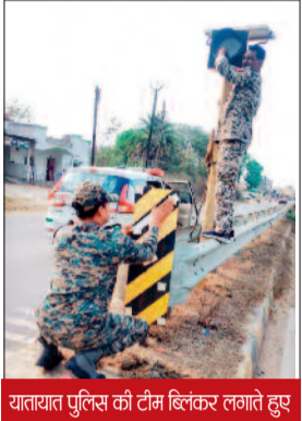
यातायात पुलिस की टीम ब्लिंकर लगाते हुए

आगे प्रत्येक वाहन से टोल टैक्स वसूला जा रहा है। इस सड़क की मॉनीटरिंग और मरम्मत करने की जिम्मेदारी एनएचआई पर है, परंतु इस विभाग के धमतरी में बैठे अधिकारियों को इससे कोई लेना देना नहीं है। यातायात विभाग कांकेर मजबूरी में हादसों को रोकने के लिए ब्लिंकर लगाते हुए बेरीकेट्स लगा रहे हैं। नाथियानवागांव से लेकर मचांदुर तक कई जगह सड़कों के मध्य में लोहे के राड से डिवाइडर बनाए गए हैं। इन सभी डिवाइडरों में कई बार वाहन