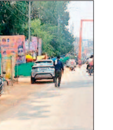
खड़ी कर रहे हैं। इससे हादसे की आशंका बढ़ती जा रही है, लेकिन जिम्मेदार बेखबर हैं। साल 2013 में नगर पालिका ने लाखों की लागत से नया सब्जी बाजार बनवाया था, जो आज तक ठीक से आबाद नहीं हो पाया है। अब यहाँ डोम भी बनाया जा चुका है। उसके बाद भी सब्जी व फल विक्रेता सड़क किनारे ही दुकान सजा रहे हैं। रविवार और बुधवार साप्ताहिक बाजार को छोड़

हरिभूमि न्यूज ►► कांकेर नगर कांकेर में नया सब्जी बाजार बनकर तैयार हो गया है, यहाँ तक अब तो शेड भी बन गया है। यहाँ पर बुधवार और रविवार को सब्जी दुकानें सजती हैं, इसके बाद अन्य दिनों में सड़कों किनारे सब्जी दुकानें सज रही हैं। गांव के सब्जी विक्रेता कोचियों से परेशान होकर उनसे बचने के लिए दो रुपए ज्यादा कमाने के लिए सड़क किनारे लगाते हैं, यह तो दो से तीन घंटे में सब्जी बेंचकर चले जाते हैं, परंतु सब्जी कोचिया बाजार स्थल के बजाए सड़क किनारे दिनभर दुकान सजाएँ रहते हैं, जिससे दुर्घटना की संभावना संदेव बनी रहती है। शहर के लोग नगर पालिका की नई टीम से यही अपेक्षा करती है कि सब्जी बाजार