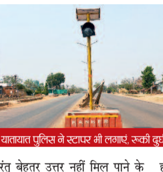
यातायात पुलिस ने स्टोपर भी लगाए, रस्की दुर्घटनाएं

दुर्घटनाग्रस्त हो चुके हैं। इन स्थानों पर लगाने वाले ब्लिंकर व अन्य संकेतक टूट गए हैं। वास्तव में इनको सुधार करने की जिम्मेदारी एनएचआई की है, परंतु इस विभाग के अधिकारी धमतरी में बैठे हैं और नाथियानवागांव से मचांदुर के मध्य में टूटे डिवाइडरों को बनाने के लिए सुध नहीं ले रहे हैं। डिवाइडरों पर लगातार सड़क दुर्घटनाएं होने के कारण सुधार के लिए यातायात पुलिस ने एनएचआई से संवाद किया,