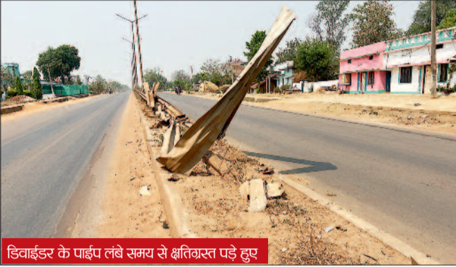
डिवाइडर के पार्श्व लंबे समय से क्षतिग्रस्त पड़े हुए

हरिभूमि न्यूज ►► कांकेर नाथियानवागांव से धमतरी के पास तक एनएचआई ने सड़क का उन्नीयकरण किया और मरकाटोला के ■ आम जनता की मांग लापरवाही बरतने वाले अधिकारियों पर दर्ज हो मामला