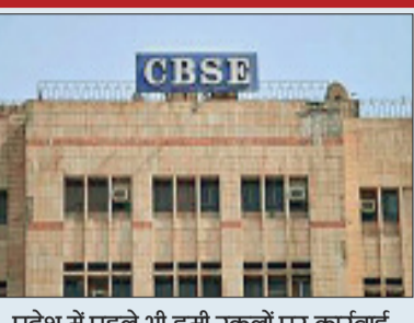
प्रदेश में पहले भी डमी स्कूलों पर कार्रवाई खत्म हुई थी रायपुर के स्कूल की मान्यता

पिछले कुछ सालों से 'डमी स्कूलों' में एडमिशन का चलन काफी बढ़ गया है। डमी स्कूल ऐसे स्कूल होते हैं जहां छात्रों नहीं जाना होता है। कोचिंग संस्थान छात्रों पर स्कूल के कार्यक्रम को कम करने के लिए नियमित स्कूलों के साथ गठजोड़ करते हैं। ऐसा करने से स्टूडेंट को जीट, जेईई या एनडीए जैसे दूसरी प्रवेश परीक्षा की तैयारी करने के लिए अधिक समय मिलता है। परेंट्स अपने बच्चों को इंजीनियर और डॉक्टर बनाने की चाह में 'डमी स्कूलों' में एडमिशन कराते हैं और जीट और जेईई की तैयारी के लिए कोचिंग सेंटर भेज देते हैं। हब्स स्कूल केवल सीबीएसई बोर्ड परीक्षा में भाग लेने के लिए एडमिंट कार्ड केवल कलेक्टर करने और बोर्ड रिजल्ट के बाद मार्कशीट और सर्टिफिकेट लेने आता है।