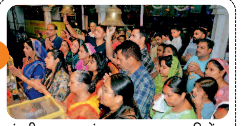
पंचमी पर आज मां महामाया का 20 साड़ियों...