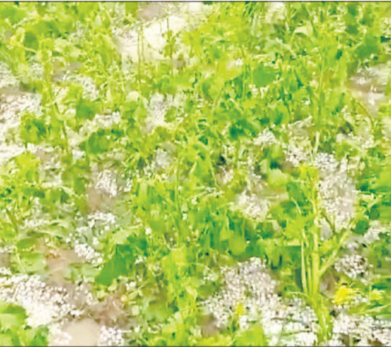
फतेहाबाद। ओलावृष्टि से खराब हुई फसल। (फाइल फोटो)

वह किसान अपने दावे ई-क्षतिपूर्ति पोर्टल पर डाल सकते हैं। तब जिले के 146 गांवों के 2666 किसानों ने खराबे के दावे किए थे। अब राजस्व विभाग ने अपनी रिपोर्ट में नुकसान शून्य पाया है। यानि कि अब ओलावृष्टि से खराब हुई फसल का