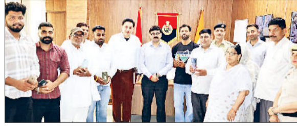
सिरसा। एसपी गुम हुए मोबाइल फोन मालिकों को सौंपते हुए।