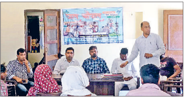
फतेहाबाद। फतेहाबाद। जल चौपाल कार्यक्रम के तहत ग्राम पंचायत खान मोहम्मद की ग्राम सभा में उपस्थित अधिकारी।

बताया कि जल जीवन मिशन के तहत जिले की सभी ग्राम पंचायतों में ग्राम पंचायतों में स्वच्छ जल मुहैया करवाया जाएगा। इसके साथ ही पीने के पानी से संबंधित जो भी समस्याएं हैं उन सभी समस्याओं को