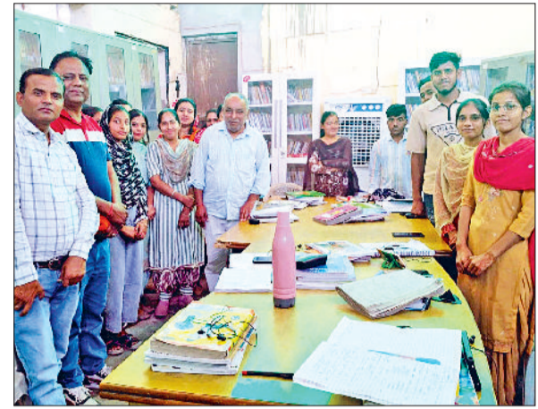
फतेहाबाद। विश्व पुस्तक दिवस पर आयोजित कार्यक्रम में मौजूद पार्षद व विद्यार्थी।

पुस्तकों का संसार एक अद्भुत संसार है जो न केवल हमें ज्ञान देता है बल्कि भावनाओं, विचारों और कल्पनाओं को भी नई रोशनी प्रदान करता है। आज के डिजिटल एजेंशन के युग में भारत में पुस्तक संस्कृति का ग्राफ गिर रहा है और युवा आबादी की पढ़ने आदत तेजी से कम हो रही है। उन्होंने कहा कि यह जरूरी हो गया है पुस्तकें पढ़ने की आदत को पुनर्जीवित करें, सार्वजनिक पुस्तकालयों को पुनर्जीवित करना, बुक क्लब का गठन करना व विद्यालयों व महाविद्यालयों में पुस्तकालय पौरियड को अनिवार्य किया जा चाहिए तथा पुस्तकों को उपहार रूप देना हमारी आदत में शुमार होना चाहिए। इससे जीवन में नई दिशा मिलती है।