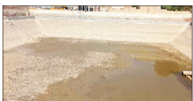
सिरसा। गांव घुकावाली में सूखी पड़ा जलघर।