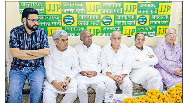
सिरसा। बैठक में भाग लेते जजपा कार्यकर्ता।

और जिन घरों में पीने का पानी नहीं पहुंचता उन घरों में पीने का पानी पहुंचा सके। गांव में जितनी भी लीकेज है उनको भी इस अभियान के दौरान चिन्हित करके ठीक करवाया जाएगा।