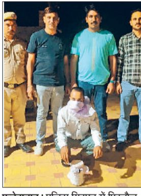
फतेहाबाद। पुलिस गिरफ्तार में पिस्तौल सहित पकड़ा गया युवक।