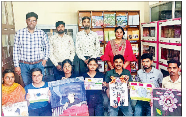
फतेहाबाद। एएमएम बीएड कॉलेज में आयोजित प्रतियोगिता में बनाए गए पोस्टर दिखाते विद्यार्थी।