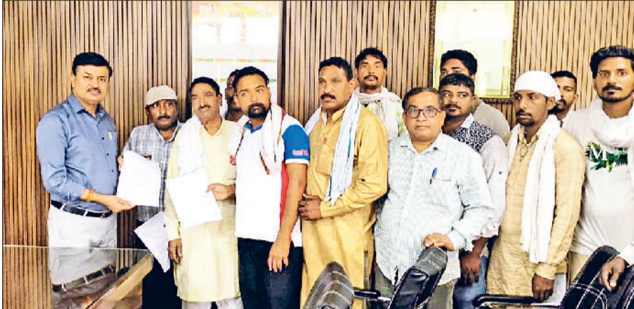
फतेहाबाद। डीएमसी को मांग पत्र सौंपते नगरपालिका कर्मचारी संघ के पदाधिकारी।

फरवरी 2023 के पत्र अनुसार कच्चे कर्मचारियों को पक्का करने, वर्ष 2014 के पत्र अनुसार 400 की आबादी पर 1 सफाई कर्मचारी की नियुक्ति, नियम अनुसार हर महीने की 7 तारीख को वेतन, काम के घण्टे तय करवाने, हटाए गए कर्मचारियों को ड्यूटी पर वापिस लेने अन्य मांगों को लेकर जिलेभर के नगरपालिका व नगरपरिषद के कर्मचारियों ने फतेहाबाद में जिला नगर आयुक्त कार्यालय पर हल्ला बोल प्रदर्शन किया। डीएमसी कार्यालय के बाहर दिए गए धरने ने फतेहाबाद के टोहना, भुना, रतिया व जाखल से पालिका कर्मचारियों ने भाग लिया और प्रशासन के खिलाफ नारेबाजी कर जमकर रोष जताया। आज के प्रदर्शन की