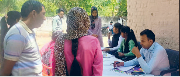
फतेहाबाद। रोजगार मेले में प्रार्थियों का पंजीकरण करते रोजगार विभाग के अधिकारी।

जिला रोजगार कार्यालय, फतेहाबाद द्वारा जिले के बेरोजगार युवाओं को निजी क्षेत्र में रोजगार के अवसर उपलब्ध करवाने के उद्देश्य से एक दिवसीय रोजगार मेले का आयोजन किया गया। इस मेले में कुल 54 बेरोजगार प्रार्थियों ने भाग लिया और विभिन्न निजी कंपनियों के समक्ष साक्षात्कार दिये। इस रोजगार मेले में मिडलैड माइक्रो फाइनेंस, अन्नपूर्णा स्मॉल फाइनेंस, शक्ति मोटर्स, पुष्पराज हेल्थकेयर, श्री राम पूनिया कोऑपरेटिव व फाइनआईसी जैसे