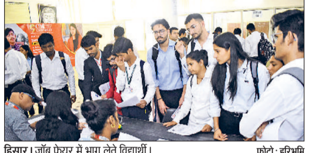
हिसार। जॉब फेयर में भाग लेते विद्यार्थी।

ओम स्टर्लिंग ग्लोबल विश्वविद्यालय में आयोजित तीन दिवसीय रोजगार मेला पूल कैंपस का भव्य समापन हुआ। तीन दिन के इस रोजगार मेले में 48 से अधिक कंपनियों ने हिस्सा लिया और जॉब फेयर में पूरे हरियाणा प्रदेश के विद्यार्थियों ने भाग लिया। रोजगार मेले में लगभग 338 से अधिक उम्मीदवारों का चयन हुआ। और उनके उज्वल भविष्य की