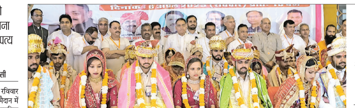
अतिथि रहे और नव विवाहित जोड़ों को खुशहाल दंपत्य जीवन का आशीर्वाद दिया। उन्होंने श्री सेवा समिति द्वारा जनहित में किए जा रहे कार्यों की