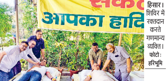
हिसार। शिविर में रक्तदान करते गणमान्य व्यक्ति।

जैन धर्म के वर्तमान शासन नायक 1008 भगवान श्री महावीर स्वामी के जन्म कल्याणक महोत्सव के उपलक्ष्य में हिसार में विभिन्न कार्यक्रमों की श्रृंखला का शुभारंभ रविवार को भव्य रक्तदान शिविर के साथ हुआ। हर वर्ष की तरह इस वर्ष भी जैन धर्म के तीनों पंथ एकजुट होकर सकल जैन समाज के बैनर तले इस पावन महोत्सव को उत्साह और एकता के साथ मना रहे हैं। महोत्सव की शुरुआत जैन औषधालय प्रांगण