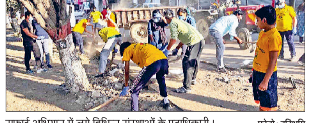
सफाई अभियान में लगे विभिन्न संस्थाओं के पदाधिकारी।

रामनवमी के शुभ अवसर पर रविवार सुबह एक बार फिर नगर निगम और सामाजिक संस्थाओं के कार्यकर्ता शहर को साफ करने के लिए सड़कों पर उतरे। इस दौरान अर्बन एस्टेट-II मार्केट में वर्षों से जमी मिट्टी व मलबे के ढेरों को साफ किया गया। इस सामूहिक अभियान में हमारा प्यार हिसार, रोटी सेंट्रल