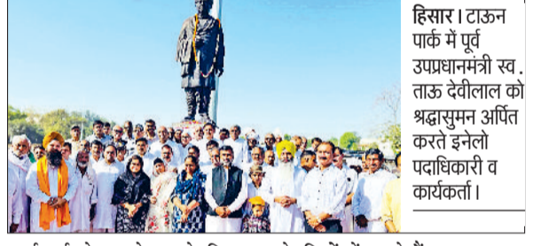
हिसार। टाऊन पार्क में पूर्व उपप्रधानमंत्री स्व. ताऊ देवीलाल को श्रद्धासुमन अर्पित करते इनेलो पदाधिकारी व कार्यकर्ता।

पूर्व उपप्रधानमंत्री जननायक ताऊ देवीलाल की 24वीं पुण्यतिथि के अवसर पर इनेलो पदाधिकारियों व कार्यकर्ताओं ने टाऊन पार्क स्थित ताऊ देवीलाल की प्रतिमा पर माल्यार्पण किया और हवन यज्ञ में आहुति डालकर उनके दिखाए हुए रास्ते पर चलने का प्रण लिया। इस दौरान सर्व धर्म प्रार्थना व सद्भावना सभा का भी आयोजन किया गया। सर्वधर्म प्रार्थना सभा में हिंदू, मुस्लिम, सिख व ईसाई धर्म के