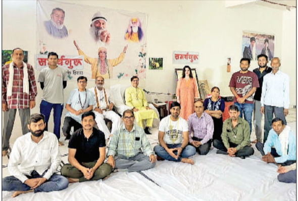
हिसार। कौशिक नगर स्थित साधना केंद्र में ध्यान करते साधक।