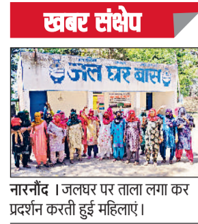
नारनौद। जलघर पर ताला लगा कर प्रदर्शन करती हुई महिलाएं।