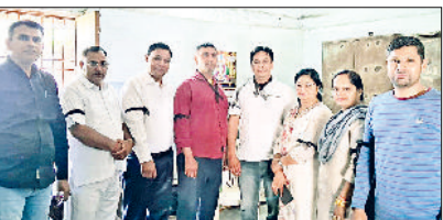
बहादुरगढ़। काली पट्टी बांधकर विरोध जताते कर्मचारी।

बहादुरगढ़। पेशन बहाली संघर्ष समिति हरियाणा के आह्वान पर बहादुरगढ़ में कर्मचारियों ने मंगलवार को युनिफाइड पेशन स्क्रीम के विरोध में ब्लैक डे मनाया। कर्मचारियों ने हाथ पर काली पट्टी बांधकर अपना विरोध दर्ज करवाया। उनके अनुसार न्यू पेशन स्क्रीम की तरह युनिफाइड पेशन स्क्रीम में भी अनेक कमियां हैं। उन्होंने कहा कि कर्मचारी एनपीएस या यूपीएस की बजाय ओपीएस ही चाहिए।