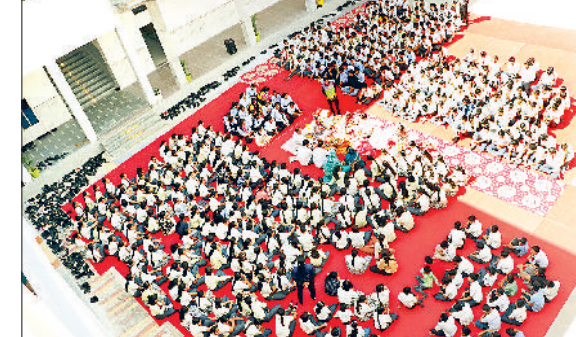
झज्जर। हवन कार्यक्रम में मौजूद शिक्षक एवं विद्यार्थी।

संस्कारम पब्लिक स्कूल में मंगलवार से नए सत्र की शुरुआत की गई। नए सत्र को प्रवेशोत्सव के तौर पर मनाया गया। स्कूल में हवन पूजन व सरस्वती पूजन का आयोजन किया गया। इसके बाद कक्षाओं का संचालन करते हुए शिक्षकों ने सभी बच्चों का स्वागत किया और नए सत्र की शुभकामनाएं दीं। सत्र के पहले दिन स्कूल आने को लेकर बच्चों में काफी उत्साह रहा। इस दौरान हवन कार्यक्रम का आयोजन भी किया