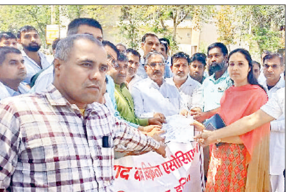
झज्जर। नायब तहसीलदार को ज्ञापन सौंपते हुए खाद बीज विक्रेता एसोसिएशन के पदाधिकारी।

सरकार की नई पॉलिसी के विरोध में एकजुट हुए खाद बीज विक्रेता हरिभूमि न्यूज झज्जर मंगलवार को खाद बीज विक्रेता एसोसिएशन द्वारा शहर की चौधरी छोट्टराम धर्मशाला में मीटिंग का आयोजन किया गया। मीटिंग में सरकार द्वारा शुरू की गई नई पॉलिसी का विरोध जताया गया।