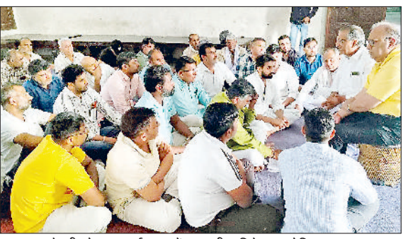
झज्जर। चौधरी छोट्टराम धर्मशाला में खाद बीज विक्रेता एसोसिएशन सदस्य बैठक कर रणनीति बनाते हुए।

सरकार की नई पॉलिसी के विरोध में एकजुट हुए खाद बीज विक्रेता हरिभूमि न्यूज झज्जर मंगलवार को खाद बीज विक्रेता एसोसिएशन द्वारा शहर की चौधरी छोट्टराम धर्मशाला में मीटिंग का आयोजन किया गया। मीटिंग में सरकार द्वारा शुरू की गई नई पॉलिसी का विरोध जताया गया।