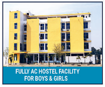
FULLY AC HOSTEL FACILITY FOR BOYS & GIRLS

JHAJJAR CAMPUS : NH.334B, Main Dadri Road, Khatiwas, Jhajjar, 8222889860, 8222889862 | PATAUDA CAMPUS : NH. 352, Patauda, Near Kulana, Jhajjar, 9053007801, 9053007802