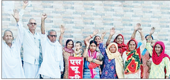
बहादुरगढ़। रसोई गैस के दाम बढ़ाने का विरोध करते एसयूसीआई के सदस्य।

एसयूसीआई (कम्युनिस्ट) के कार्यकर्ताओं तथा समर्थकों ने बीजेपी सरकार द्वारा घरेलू गैस के दाम 50 रुपए प्रति सिलेंडर बढ़ाने के खिलाफ मंगलवार को लाइनपार में विरोध प्रदर्शन किया। इस दौरान नारेबाजी करते हुए रसोई गैस के