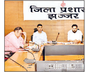
झज्जर। बैठक के दौरान उपस्थित रोहतक मंडल आयुक्त पीसी मीणा व डीसी प्रदीप दहिया।