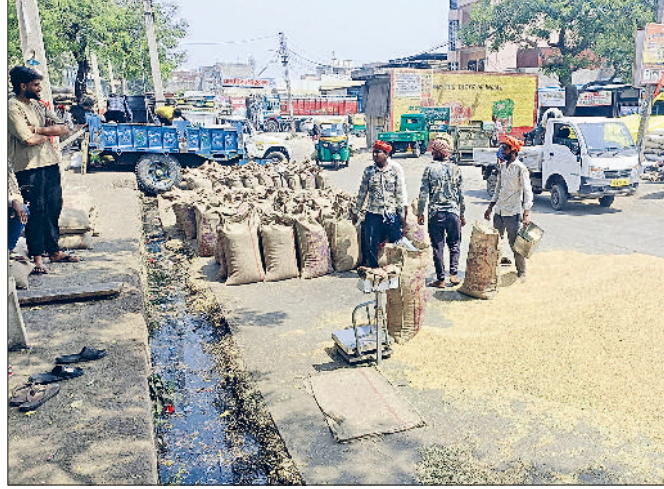
बहादुरगढ़। शहर की अनाज मंडी में सड़क पर फैला गेहूँ का ढेर।