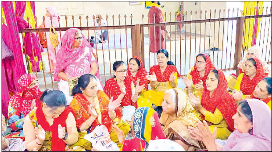
झज्जर। मां भीमेश्वरी देवी मंदिर में माता का गुणगान करते हुए श्रद्धालु।