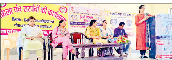
कार्यक्रम के दौरान उपस्थित पंचों व सरपंचों को संबोधित करते हुए तहसीलदार सृष्टि दूहन।

अप्रैल को हिसार में होने वाली प्रधानमंत्री नरेंद्र मोदी की रैली को लेकर भी मंथन किया गया।