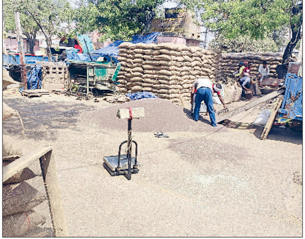
बहादुरगढ़। अनाज मंडी की फड़ पर लगे सरसों के बोरे।