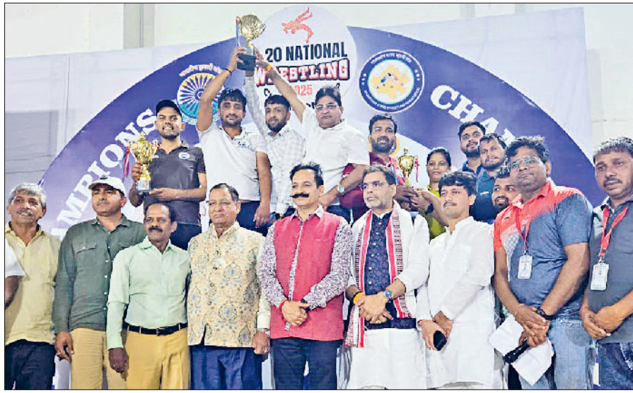
बहादुरगढ़। राजस्थान में जीतने वाले हरियाणा के जूनियर पहलवान।

चैंपियनशिप में हरियाणा की महिला जूनियर टीम ने 215 पॉइंट्स