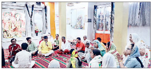
झज्जर। बाबा काशीगिरी मंदिर में भजनों का आनंद लेते हुए श्रद्धालु।