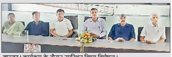
झज्जर। कार्यक्रम के दौरान उपस्थित विषय विशेषज्ञ।