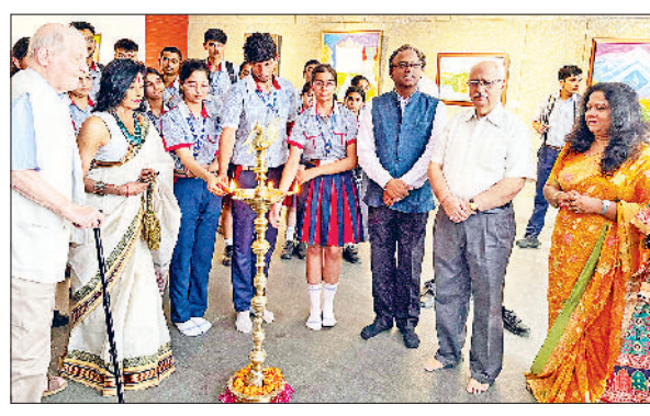
बहादुरगढ़। कला प्रदर्शनी के उद्घाटन अवसर पर मौजूद गोयनका के विद्यार्थी।

शहर की एचएल सिटी में स्थित जीडी गोयनका पब्लिक स्कूल के विद्यार्थियों को विशेष कला शैक्षणिक भ्रमण पर ले जाया गया। विद्यालय की प्रधानाचार्या के प्रेरणादायक शब्दों के साथ इसकी शुरुआत हुई। उन्होंने छात्रों को भारतीय कला की गहराई से परिचित होने का संदेश दिया।