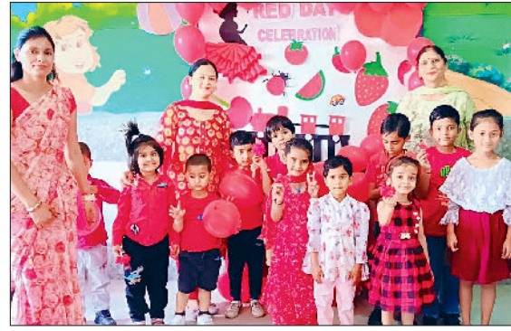
बहादुरगढ़। रेड डे पर हुई गतिविधियों में हिस्सा लेते बाल विकास स्कूल के बच्चे।