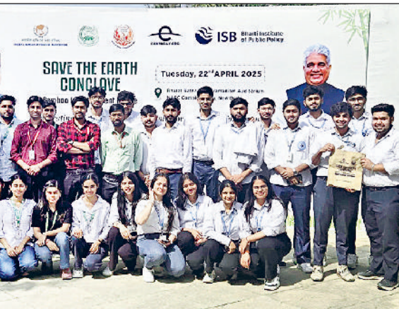
झज्जर। कार्यक्रम उपरान्त नई दिल्ली के पूसा परिसर में उपस्थित संस्कारम विश्वविद्यालय के विद्यार्थी एवं शिक्षक।