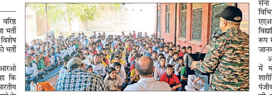
बहादुरगढ़। रामांसंवमावि में हुए कार्यक्रम में सेना भर्ती प्रक्रिया की जानकारी देते एएआरओ।

शहर के राजकीय मॉडल संस्कृति वरिष्ठ माध्यमिक विद्यालय में बुधवार को सेना भर्ती कार्यालय रोहतक द्वारा आयोजित विशेष आउटरीच कार्यक्रम में छात्र-छात्राओं को भर्ती प्रक्रिया की जानकारी दी गई।