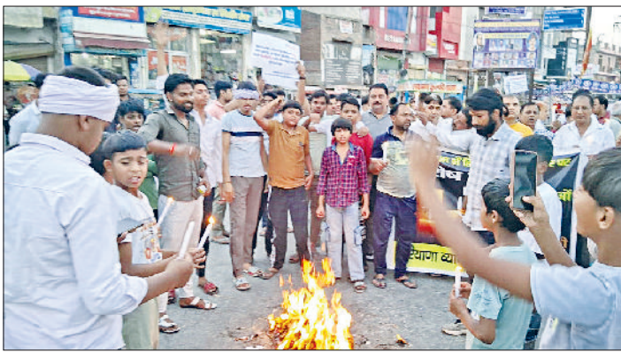
झज्जर। अंबेडकर चौक पर पुतला फूँककर विरोध जताते एबीवीपी के सदस्य।