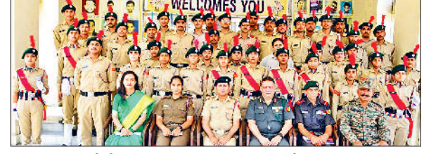
बहादुरगढ़। एनसीसी कैडेट्स के साथ कमांडिंग अधिकारी।