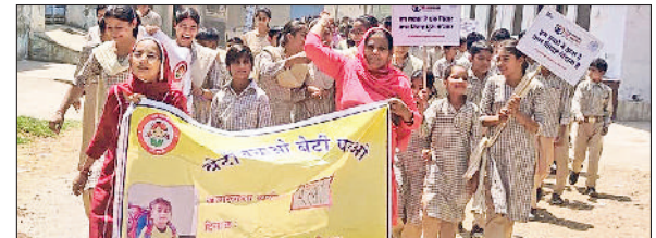
बहादुरगढ़। कानोदा में रैली निकालते विद्यार्थी।