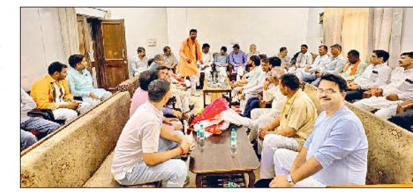
बहादुरगढ़। बैठक में कार्यकर्ताओं से चर्चा करते भाजपा के संगठन मंत्री।